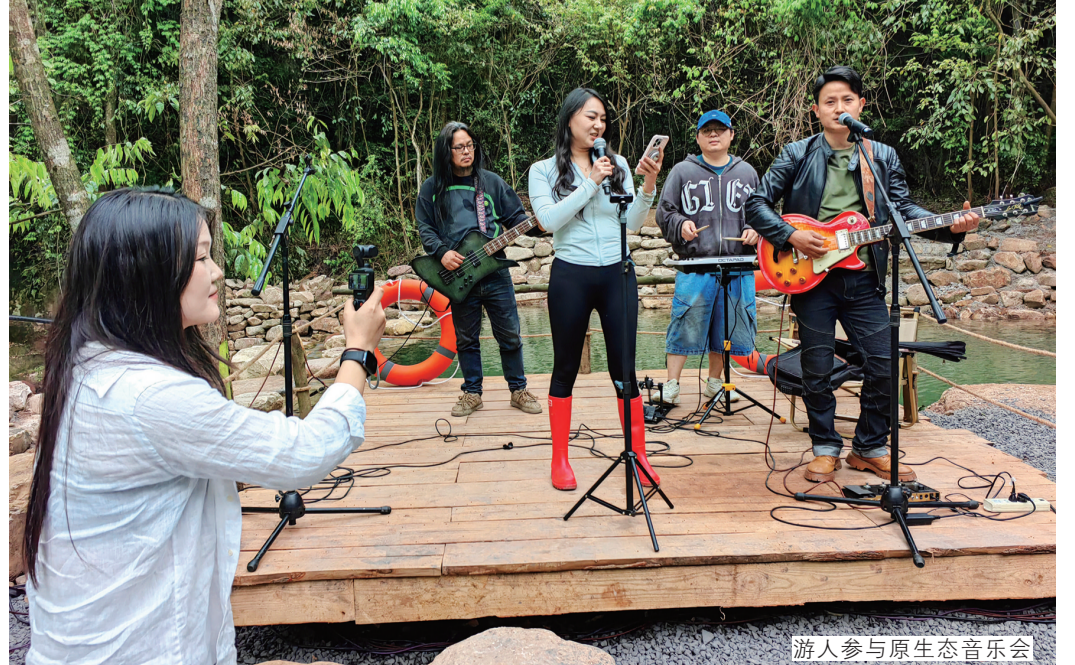
游人参与原生态音乐会