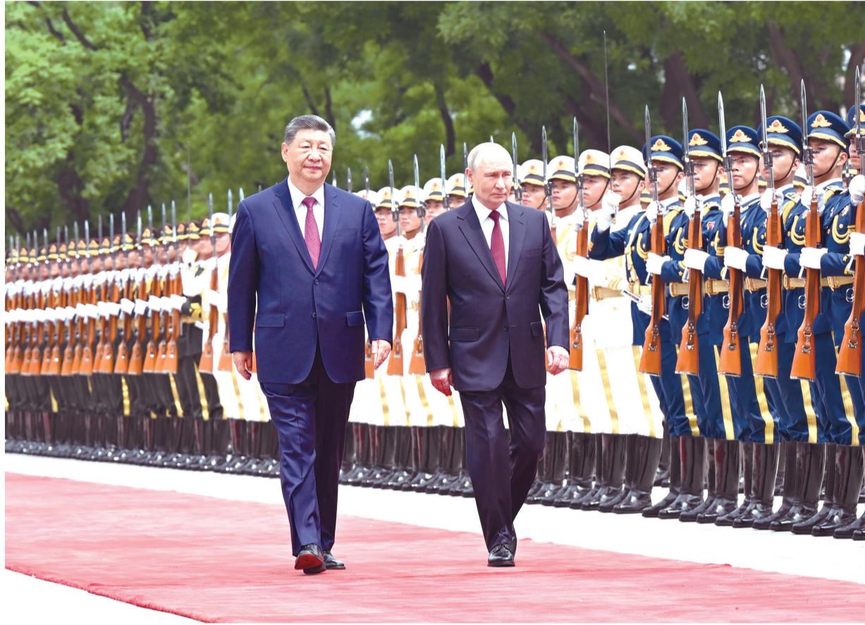
5月20日上午,国家主席习近平在北京人民大会堂同来华进行国事访问的俄罗斯总统普京举行会谈。会谈后,习近平在人民大会堂东门外广场为普京举行欢迎仪式。