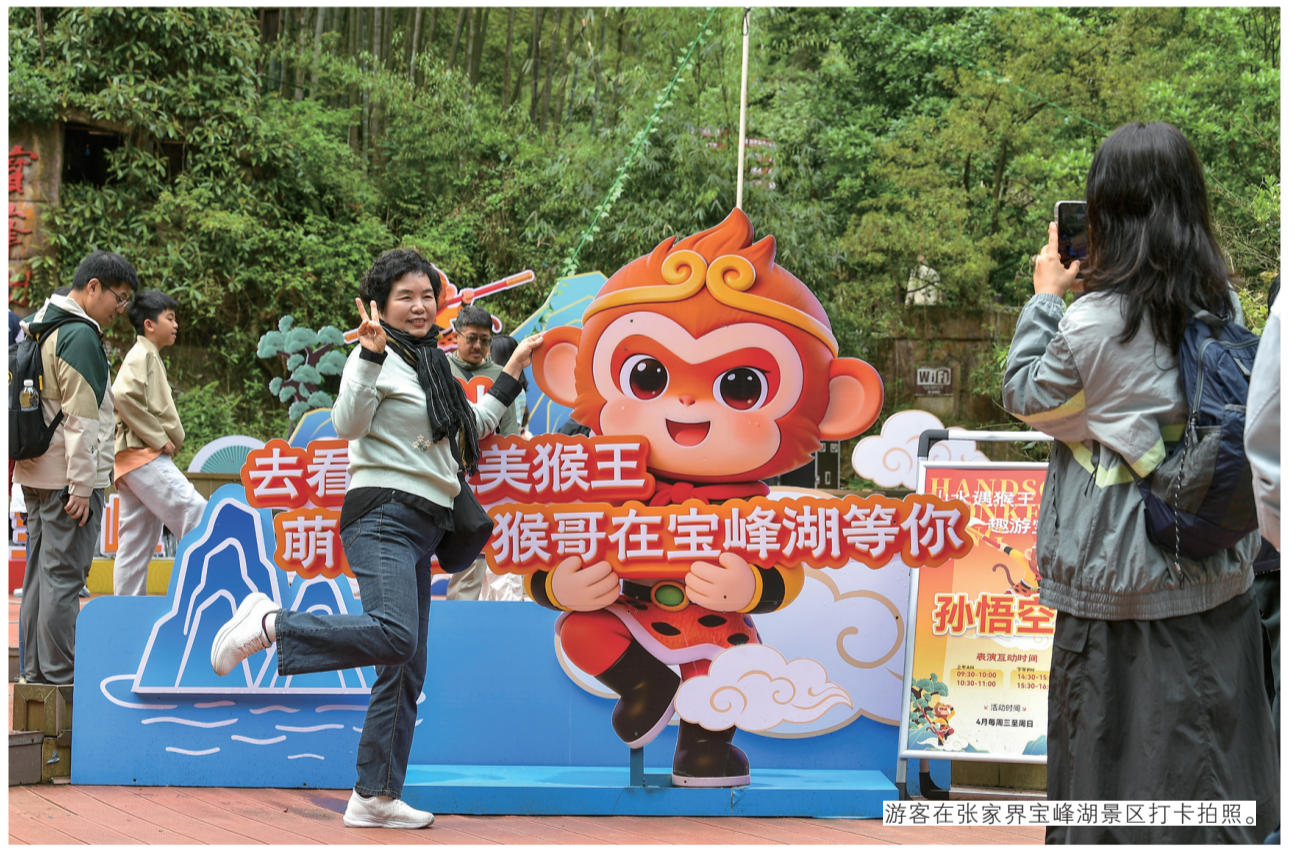
游客在张家界宝峰湖景区打卡拍照。