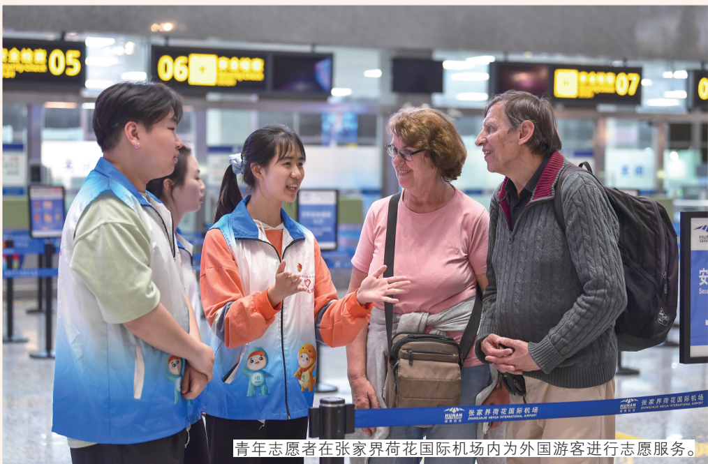
青年志愿者在张家界荷花国际机场内为外国游客进行志愿服务。