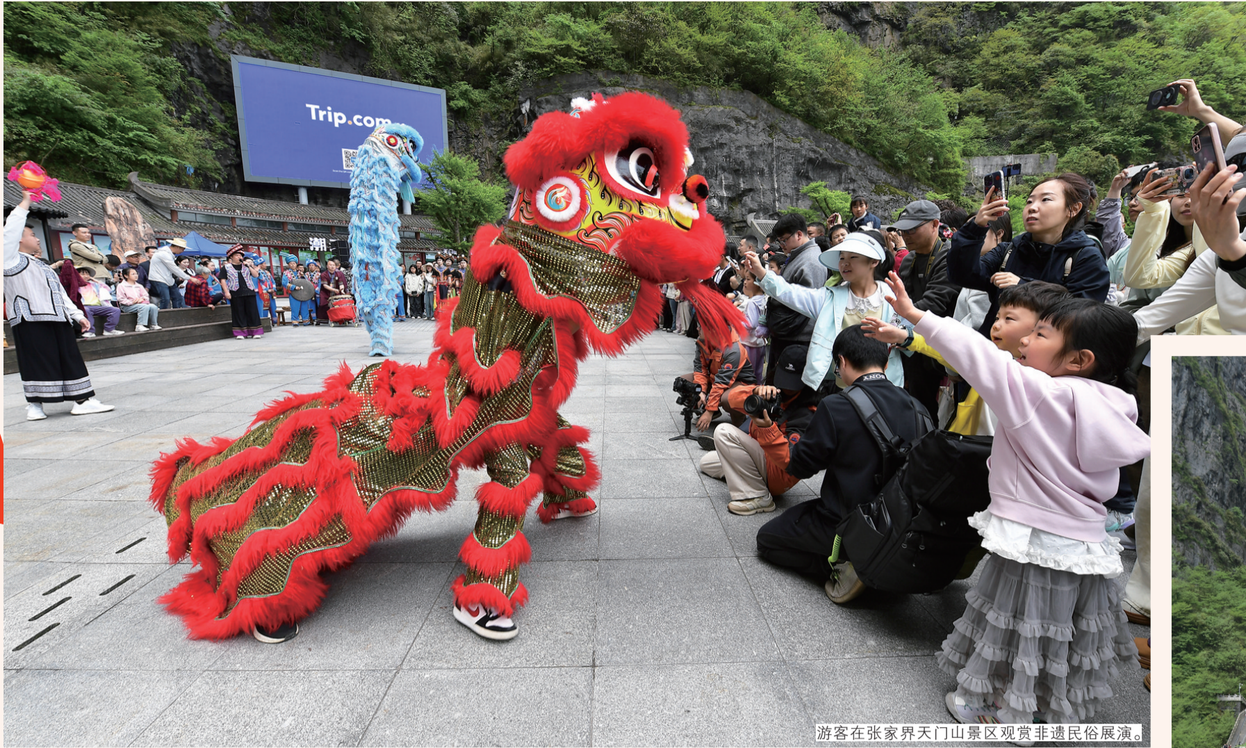
游客在张家界天门山景区观赏非遗民俗展演。