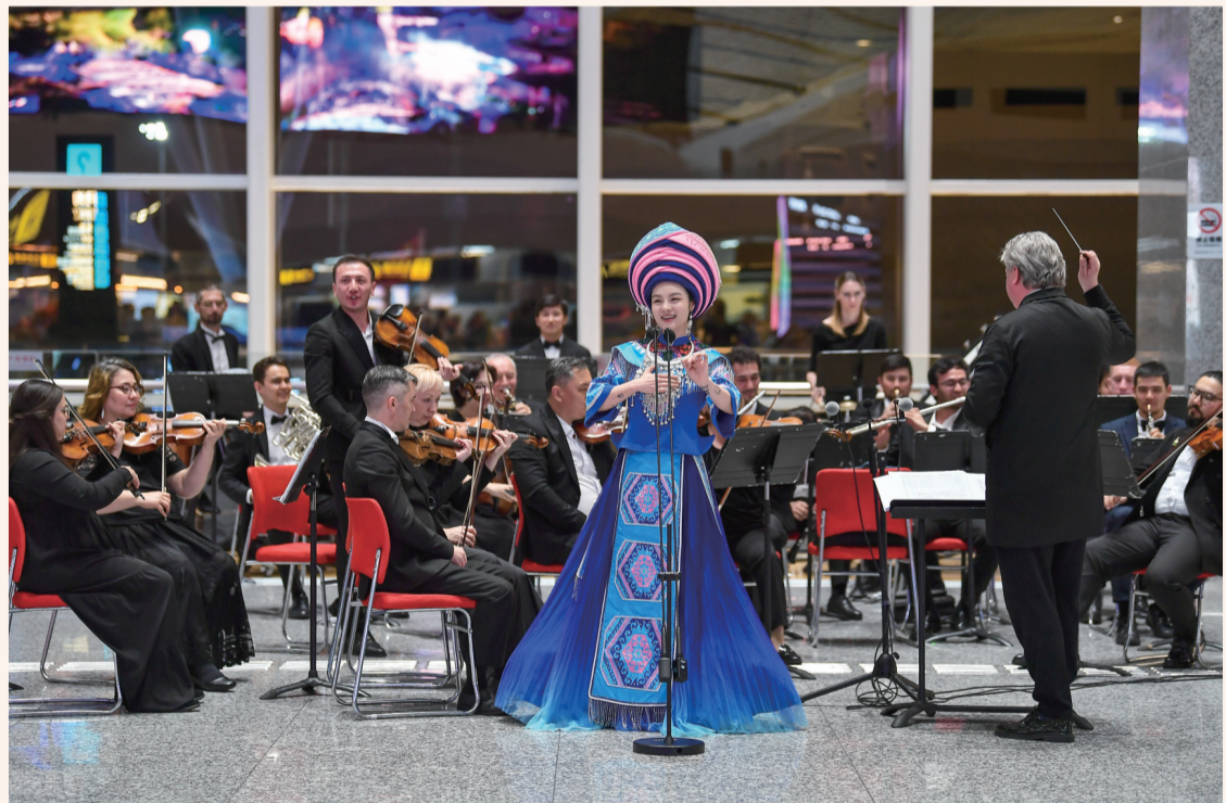
在张家界荷花国际机场内举行的土家非遗民俗展演。