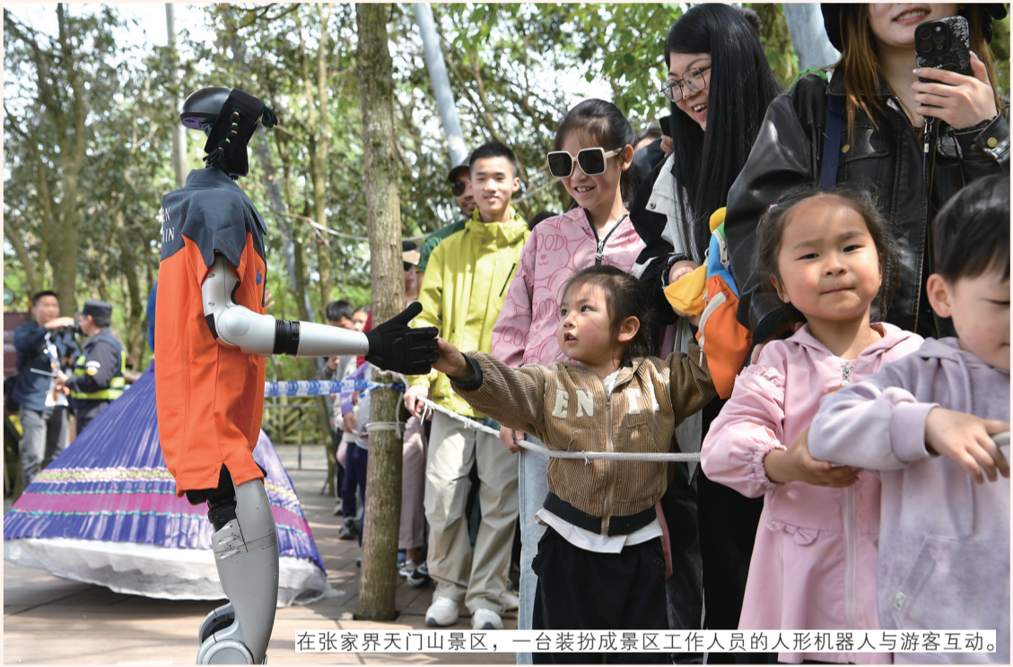
在张家界天门山景区，一台装扮成景区工作人员的人形机器人与游客互动。

刚刚过去的“五一”假期，我市文旅活动丰富多彩、亮点纷呈。在张家界天门山景区，机器人非遗舞蹈秀、舞狮、桑植民歌、摆手舞等特色巡游表演轮番上阵，吸引了众多游客驻足留影；张家界宝峰湖景区内，一场以“山水寻踪·大圣归来”为主题的文旅互动节目在游客们的欢声笑语中精彩上演，游客们近距离观赏《西游记》“真假美猴王”的经典名场面，沉浸式感受西游记故事，乐享美好假日时光；在张家界荷花国际机场，张家界爱乐团奏响天籁之音，三棒鼓、土家族打溜子、土家摆手舞等传统民俗与航空出行温馨相遇，让五湖四海的旅客在候机间隙，沉浸式感受张家界独特的民族风情与文化魅力。