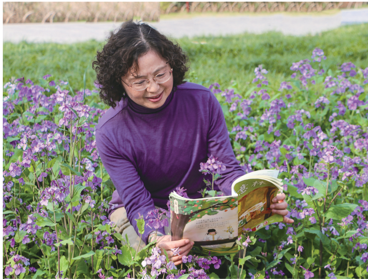
花芬芳书更香