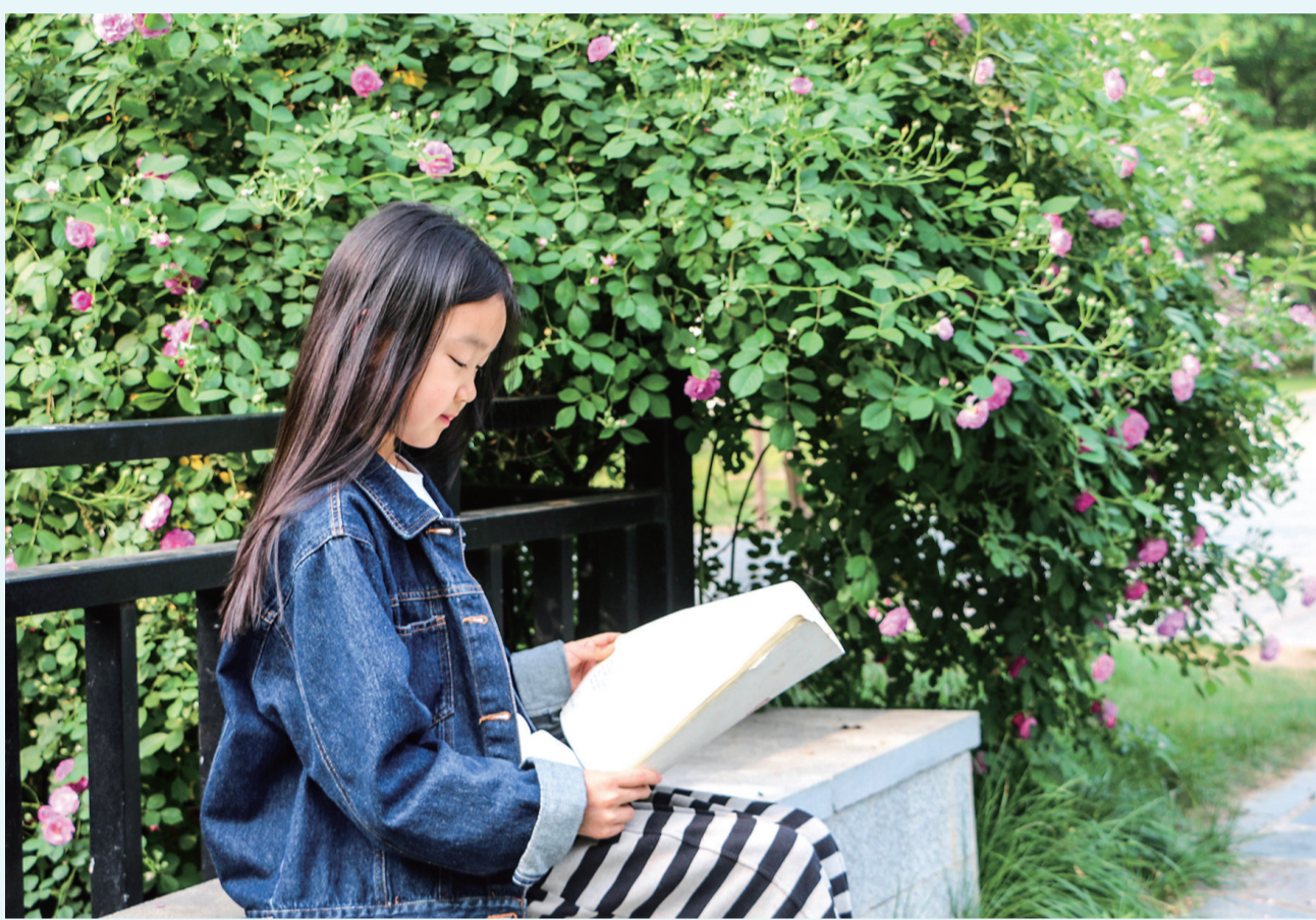
三月的芬芳