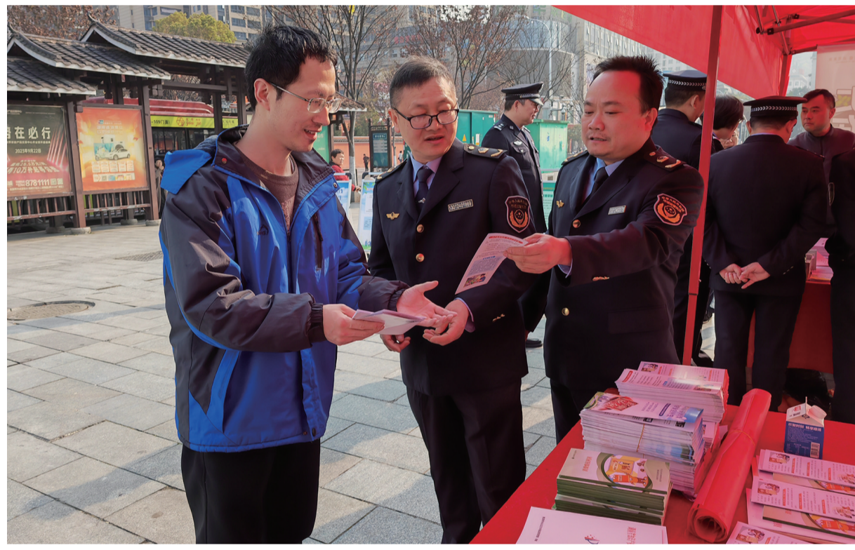
日前，永定区市场监督管理局在市中心广场开展“3·15”国际消费者权益日集中宣传活动。此次活动以“优化消费环境、提升消费品质”为主题，围绕“社会共治让食品安全在阳光下运行”，通过发放宣传资料、现场讲解、案例展示等形式，向群众普及食品药品安全知识，吸引了众多市民驻足咨询、积极参与。

活动现场，招聘区内企业展位有序排列，求职者认真咨询岗位信息、薪资待遇与发展前景，工作人员耐心答疑解惑，全力搭建用人单位与求职群众的精准对接桥梁。同时，工作人员通过设立咨询台、发放宣传手册、现场讲解等方式，向过往群众普及安全知识，既为广大群众送上“就业礼包”，又送上“平安锦囊”，有效提升了群众安全防范意识与法治观念，为建设平安、和谐、稳定的上河溪乡营造了浓厚氛围。