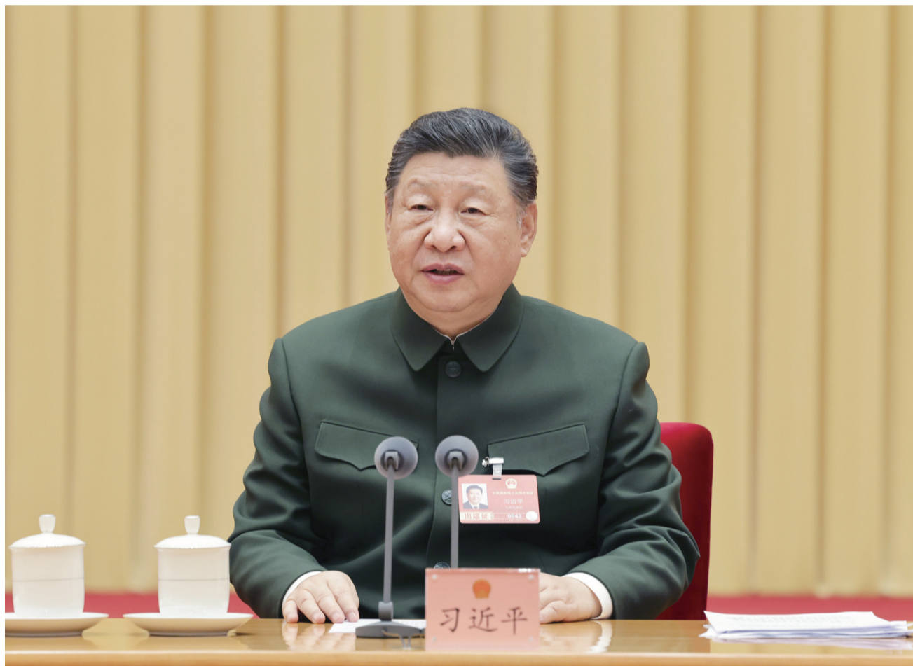
3月7日下午，中共中央总书记、国家主席、中央军委主席习近平出席十四届全国人大四次会议解放军和武警部队代表团全体会议并发表重要讲话。

习近平强调，完成“十五五”时期国防和军队现代化目标任务，归根到底要靠各级党组织来领导和推进。要全面加强我军的领导和党的建设，选准配强高层党委班子，增强基层党组织自主抓建能力，把各级党组织建设得更加坚强有力。要坚持党管军事、党管干部、党管行业，提高科学决策能力，在攻坚重大任务、化解突出矛盾、解决发展