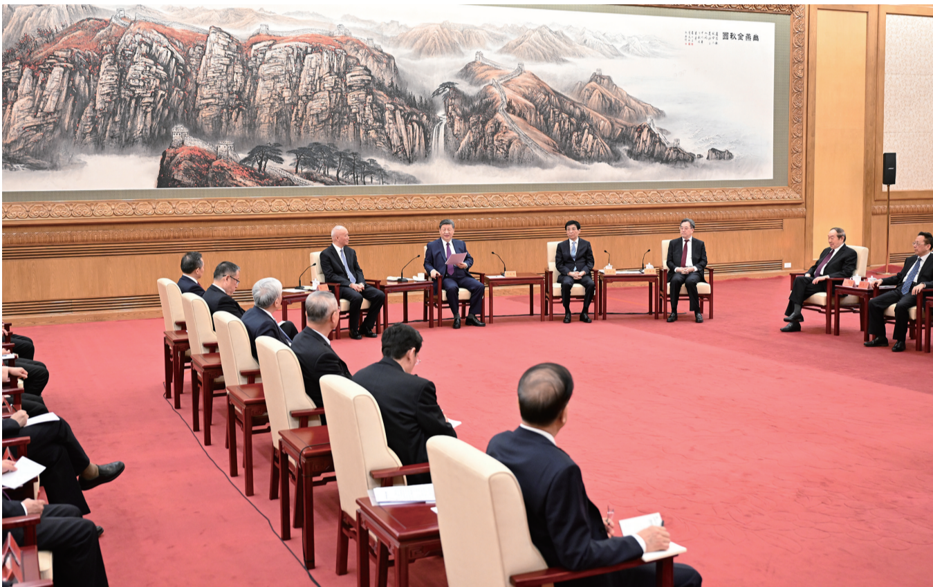
2月11日，习近平、王沪宁、蔡奇、丁薛祥等在北京人民大会堂同党外人士欢聚一堂，共迎佳节。

新华社北京2月11日电 在中华民族传统节日丙午马年春节即将到来之际，中共中央总书记、国家主席、中央军委主席习近平11日下午在人民大会堂同各民主党派中央、全国工商联负责人和无党派人士代表欢聚一堂，共迎新春。习近平代表中共中央，向各民主党派、工商联和无党派人士，向统一战线广大成员，致以诚挚问候和美好祝福。