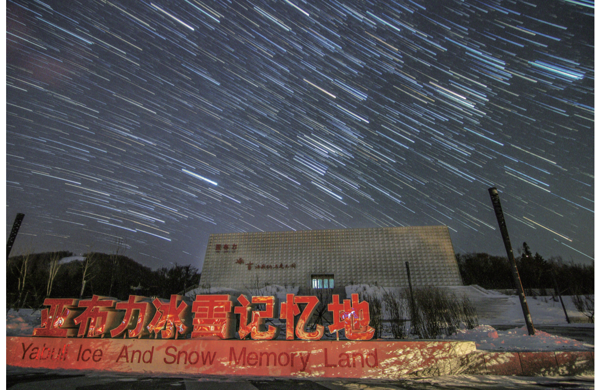
1月22日在亚布力滑雪旅游度假区拍摄的星空下的亚布力冰雪文化展馆（堆栈合成照片）。