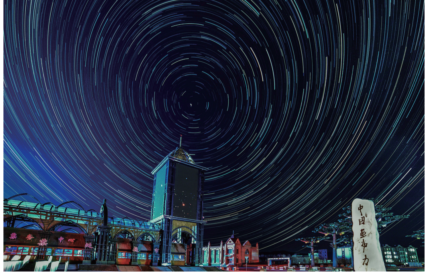
▲2025年12月13日，在亚布力滑雪旅游度假区拍摄的星空下的游客中心（堆栈合成照片）。