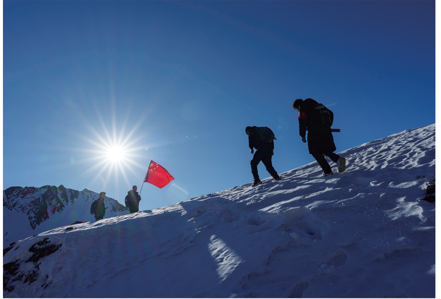
在西藏山南市隆子县玉麦乡境内，护边员们在雪坡上巡逻（2月6日摄）。