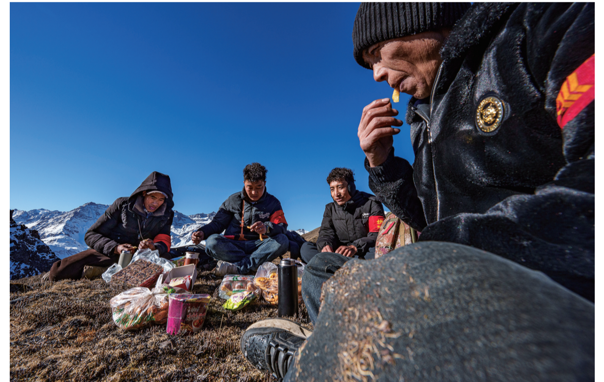
2月6日，在西藏山南市隆子县玉麦乡境内，护边员们在巡逻途中吃午饭。他们围坐在一片平坦草地，从背包里掏出糌粑、卡塞（一种传统油炸面食），再喝几口酥油茶，这就是巡逻护边途中一顿简单的午餐。