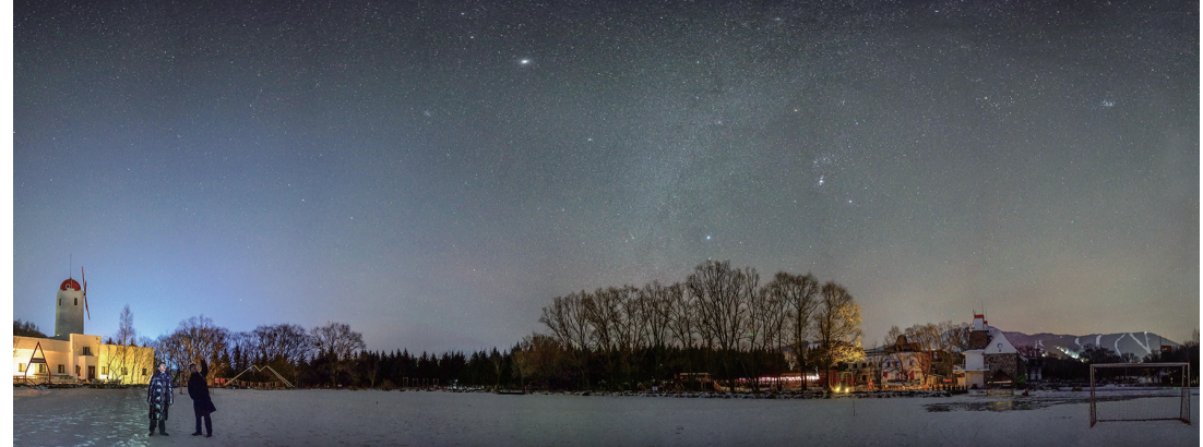
▲2025年12月14日，在亚布力滑雪旅游度假区拍摄的星空中的“冬季大三角”和猎户座（拼接照片）。