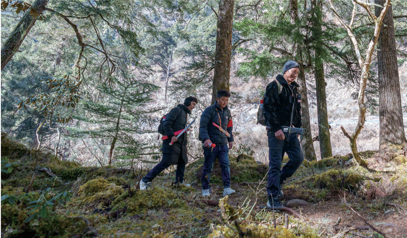
在西藏山南市隆子县玉麦乡境内，护边员们在丛林里巡逻（2月6日摄）。午饭过后，护边员们从雪线一路往下继续巡逻，海拔越来越低，树林也越来越密。茂密的藤蔓灌木有时会把人完全遮住。护边员们抽出腰间砍刀，一刀刀劈开拦路枝杈，踏出一条小径。