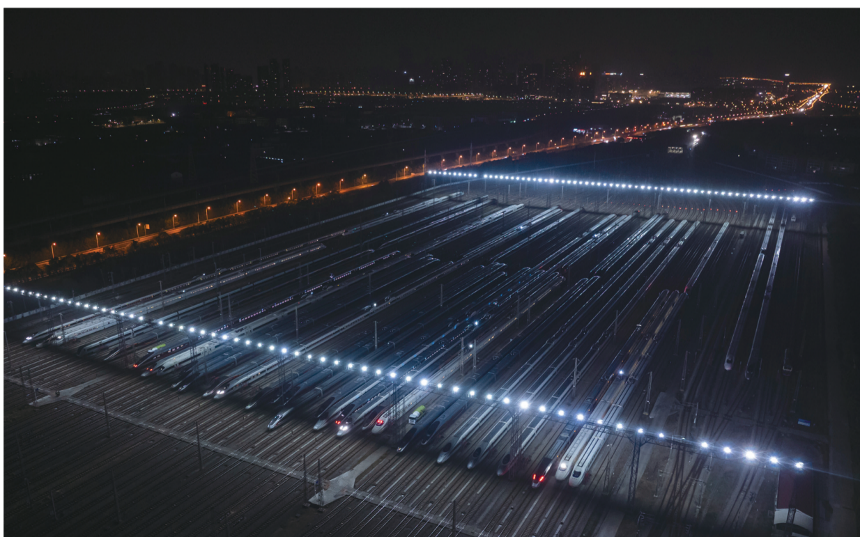
▶2月1日晚，动车组列车停靠在武汉动车段的存车线上（无人机照片）。