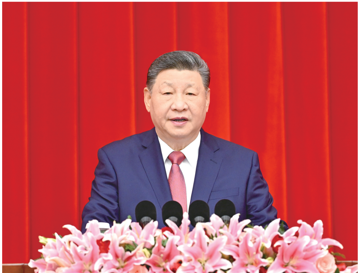
2025年12月31日，全国政协在北京举行新年茶话会。中共中央总书记、国家主席、中央军委主席习近平在茶话会上发表重要讲话。