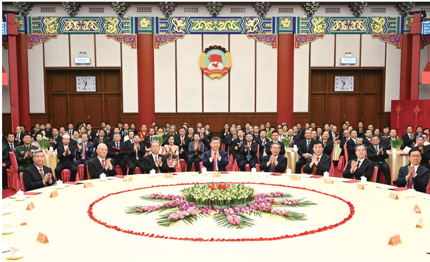
2025年12月31日，全国政协在北京举行新年茶话会。党和国家领导人习近平、李强、赵乐际、王沪宁、蔡奇、丁薛祥、李希、韩正出席茶话会并观看演出。

新华社北京2025年12月31日电 中国人民政治协商会议全国委员会2025年12月31日上午在全国政协礼堂举行新年茶话会。党和国家领导人习近平、李强、赵乐际、王沪