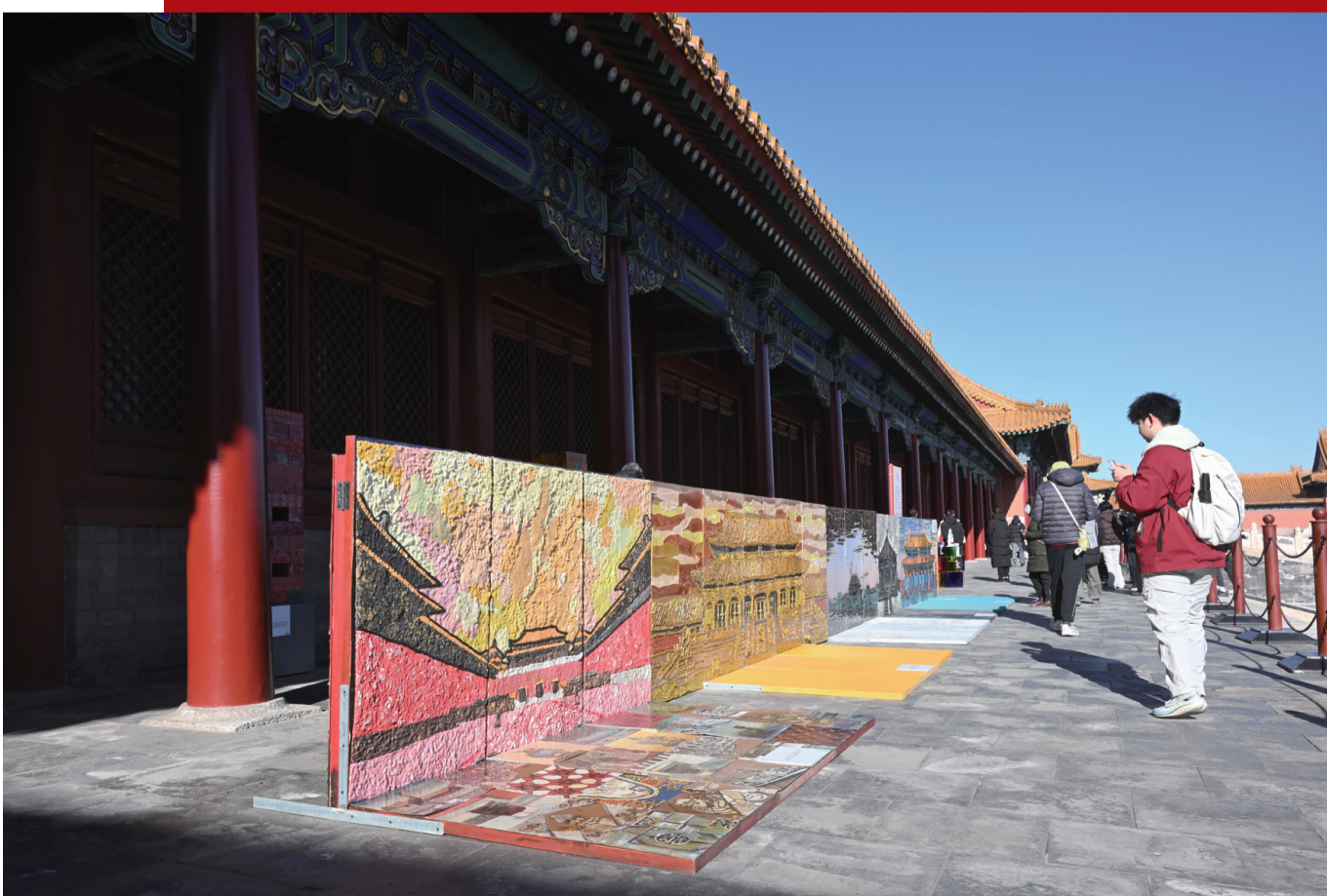
2025年12月30日，观众参观“来！听色彩讲故事”故宫教育体验展。