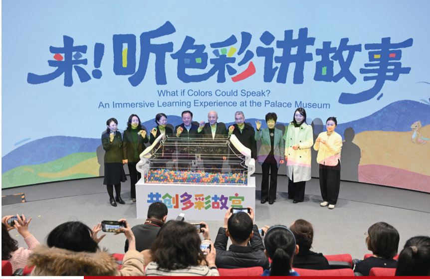
2025年12月30日，嘉宾为“来！听色彩讲故事”故宫教育体验展揭幕。