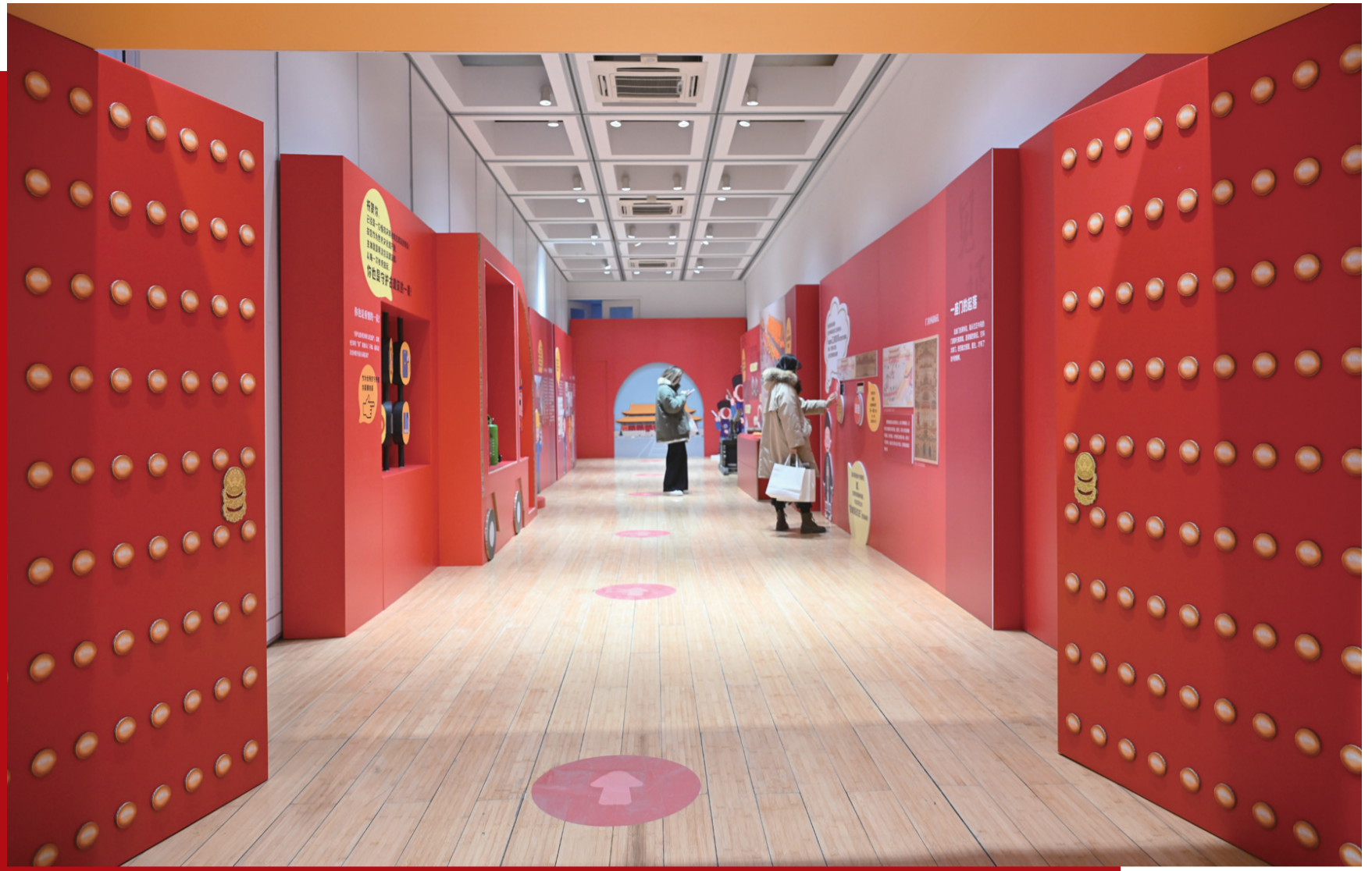
2025年12月30日，观众参观“来！听色彩讲故事”故宫教育体验展。