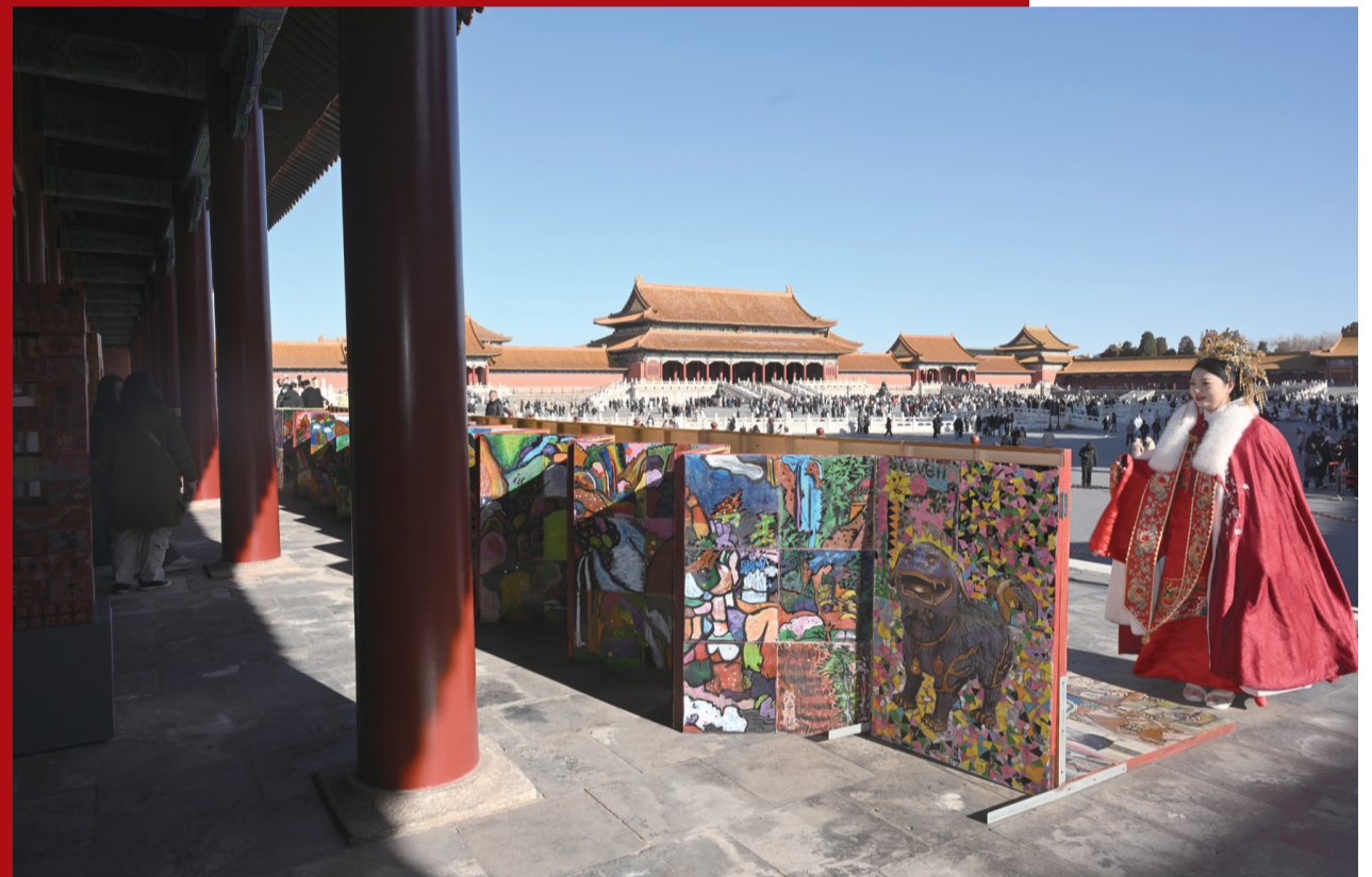
2025年12月30日，观众参观“来！听色彩讲故事”故宫教育体验展。