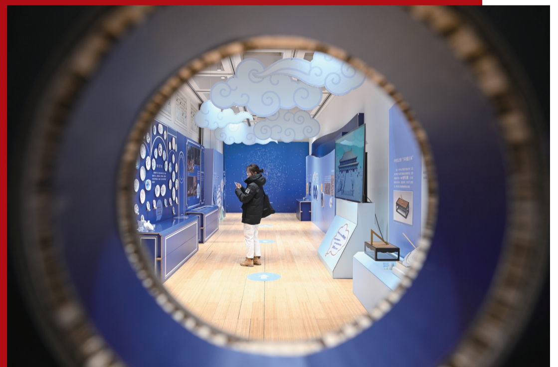
2025年12月30日，观众参观“来！听色彩讲故事”故宫教育体验展。