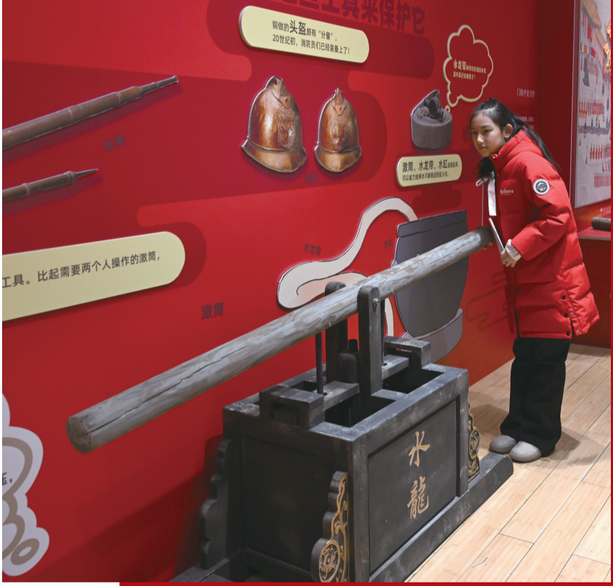
2025年12月30日，观众参观“来！听色彩讲故事”故宫教育体验展。