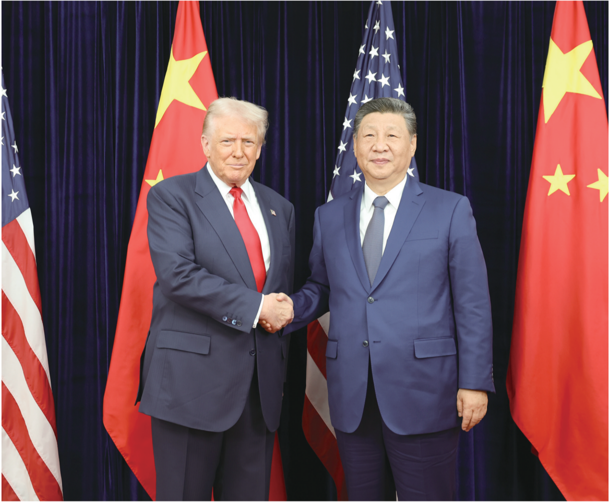
当地时间十月三十日，国家主席习近平在釜山同美国总统特朗普举行会晤。

新华社韩国釜山10月30日电（记者李忠发 郝薇薇）当地时间10月30日，国家主席习近平在釜山同美国总统特朗普举行会晤。 习近平指出，中美关系在我们共同引领下，保持总体稳定。两国做伙伴、做朋友，这是历史的启示，也是现实的需要。两国国情不同，难免会有一些分歧，作为世界前两大经济体，时而也会有摩擦，这很正常。面对风浪和挑战，两国元首作为掌舵人，应当把握好方向、驾驭住大局，让中美关系这艘大船平稳前行。我愿继续同特朗普总统一道，为中美关系打下一个稳固的基础，也为两国各自发展营造良好的环境。 习近平强调，中国经济发展势头不错，今年前三季度增长率达5.2%，对全球的货物贸易进出口增长4%，这是克服内外困难实现的，来之不易。中国经济是一片大海，规模、韧性、潜力都比较大，我们有信心也有能力应对各种风险挑战。中共二十届四中全会审议通过了未来5年的国民经济和社会发展规划建议。70多年来，我们坚持一张蓝图绘到底，一茬接着一茬干，从来没有想挑战谁、取代谁，而是集中精力办好自己的事，做更好的自己，同世界各国分享发展机遇。这是中国成功的重要密码。中国将进一步全面深化改革、扩大对外开放，着力推动经济实现质的有效提升和量的合理增长，推进人的全面发展和全体人民共同富裕，相信这也将为中美合作开辟更广阔空间。 习近平指出，两国经贸团队就重要经贸问题深入交换意见，形成了解决问题的共识。双方团队要尽快细化和敲定后续工作，将共识维护好、落实好，以实实在在的成果，给中美两国和世界吃下一颗“定心丸”。中美经贸关系近期经历曲折，也给双方带来一些启示。经贸应该继续成为中美关系的压舱石和推进器，而不是绊脚石和冲突点。双方应该算大账，多看合作带来的长远利益，而不应陷入相互报复的恶性循环。双方团队可以继续本着平等、尊重、互惠的原则谈下去，不断压缩问题清单，拉长合作清单。 习近平强调，对话比对抗好。中美之间各渠道各层级应该保持沟通，增进了解。两国在打击非法移民和电信诈骗、反洗钱、人工智能、应对传染病等领域合作前景良好，对口部门应该加强对话交流，开展互利合作。中美在地区和国际舞台也应该良性互动。当今世界还有很多难题，中国和美国可以共同展现大国担当，携手多办一些有利于两国和世界的大事、实事、好事。明年，中国将担任亚太经合组织东道主，美国将主办二十国集团峰会。双方可以相互支持，争取两场峰会都取得积极成果，为促进世界经济复苏、完善全球治理作出贡献。 特朗普表示，很荣幸同习近平主席会面。中国是伟大国家，习主席是受人尊敬的伟大领导人，也是我多年的好朋友，我们相处非常愉快。中美关系一直很好，将来会更好，希望中国和美国的美好未来更加美好。中国是美国最大的伙伴，两国携手可以在世界上做成很多大事，未来中美合作取得更大成就。中国将举办2026年亚太经合组织领导人非正式会议，美国将举办二十国集团峰会，乐见双方取得成功。 两国元首同意加强双方在经贸、能源等领域合作，促进人文交流。 两国元首同意保持经常性交往。特朗普期待明年早些时候访华，邀请习近平主席访问美国。 蔡奇、王毅、何立峰等参加会见。