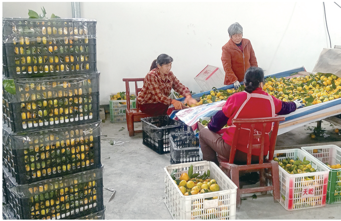
10月29日,慈利县湖南天屹农业科技有限公司临聘的10多名工人正紧张有序地对刚采摘的柑橘进行分拣、包装与搬运工作,筐筐金黄饱满的柑橘经精细分拣后,被迅速转运至储存区或直接装车发往东北三省。

接下来,永定区将持续加大整治力度,定期开展联合整治行动,加强日常巡查监管,形成长效管理机制,同时进一步加强交通安全宣传教育,提高市民交通安全意识和法律意识,引导市民主动参与到抵制非标车辆的行动中来,共同营造安全、有序、畅通的道路交通环境。