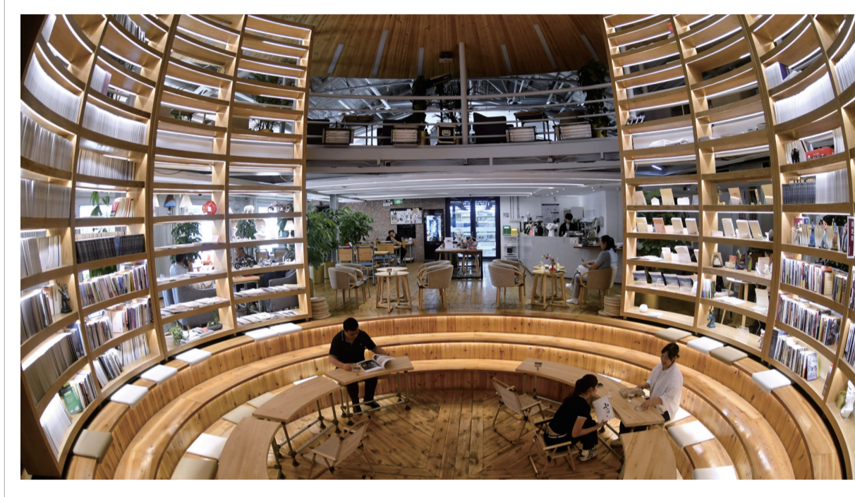
北京市丰台区纪家庙双创产业园内为青年人提供的集读书、简餐、会谈为一体的拓普原素咖啡馆（9月19日摄）。