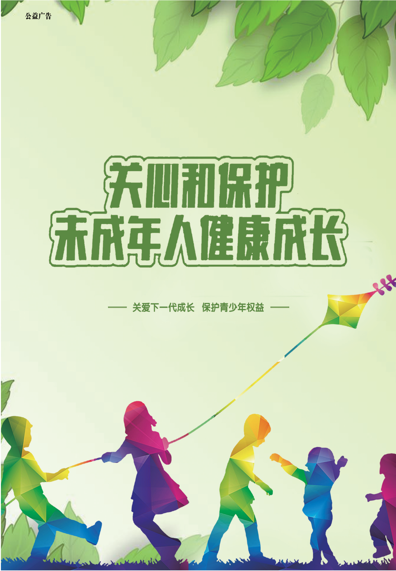
—— 关爱下一代成长 保护青少年权益 ——

军事斗争等方面的坚强领导。 即日起，公众可持身份证、工作证等有效证件到中央档案馆开放档案查阅大厅查阅利用上述档案资料。