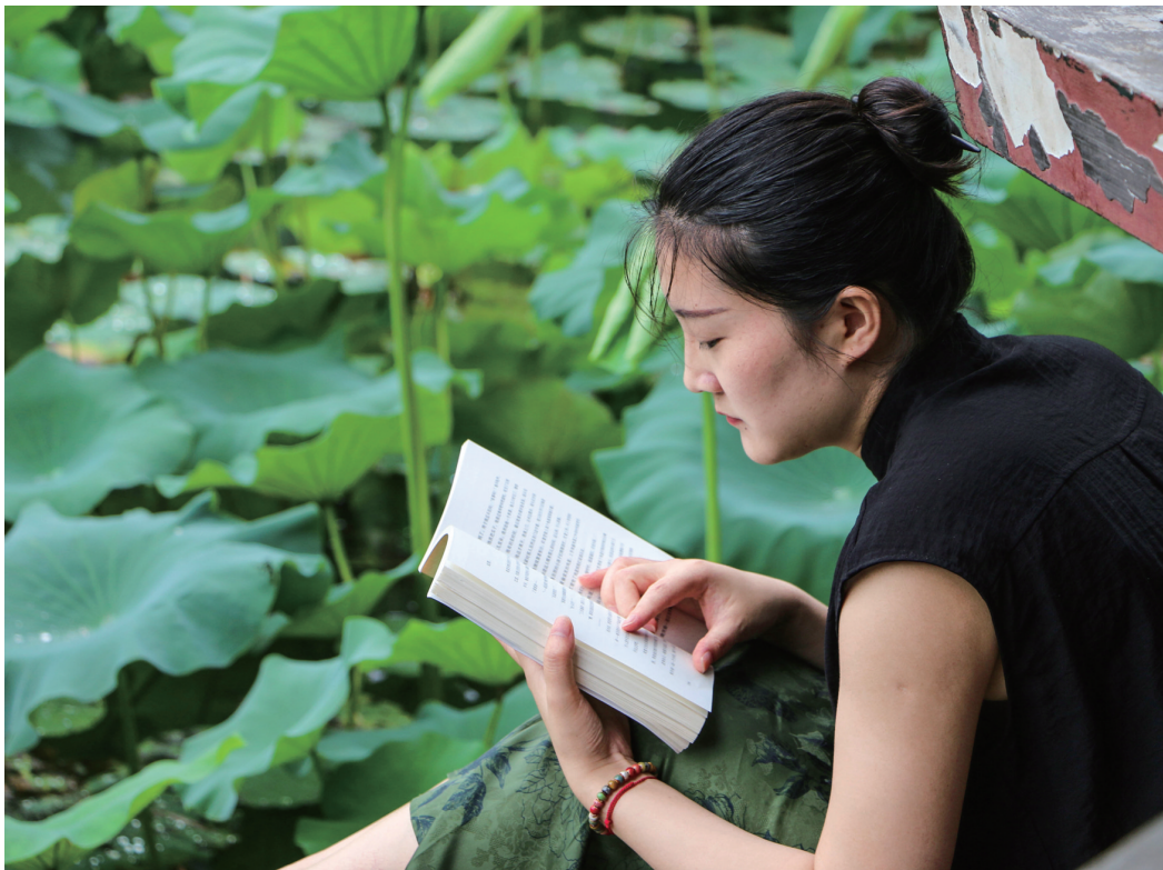
荷芬芳 书更香

为了舒缓紧张的故事情节，马伯庸有意识地通过语言来调解和把控故事的节奏，因此时有轻松诙谐之语。因折柳习俗致使灞桥周边的柳客“早早被薅秃了”，于是他说“后来之客，无枝可折，只好三枚铜钱一枝从当地孩童手里买。一番铜臭交易之后，心