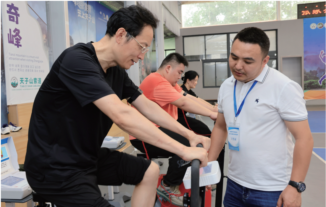
6月10日，武陵源区启动第六次全国国民体质监测工作，依据国家监测标准和要求，按分类对幼儿（3-6岁）、成年（20-59岁）人群开展体重、坐位体前屈、体脂率、握力等20余个项目监测。通过监测了解当地居民体质的变化趋势，守护居民“大健康”。