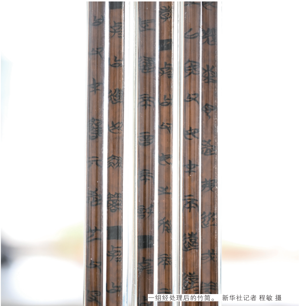
一组经处理后的竹简。