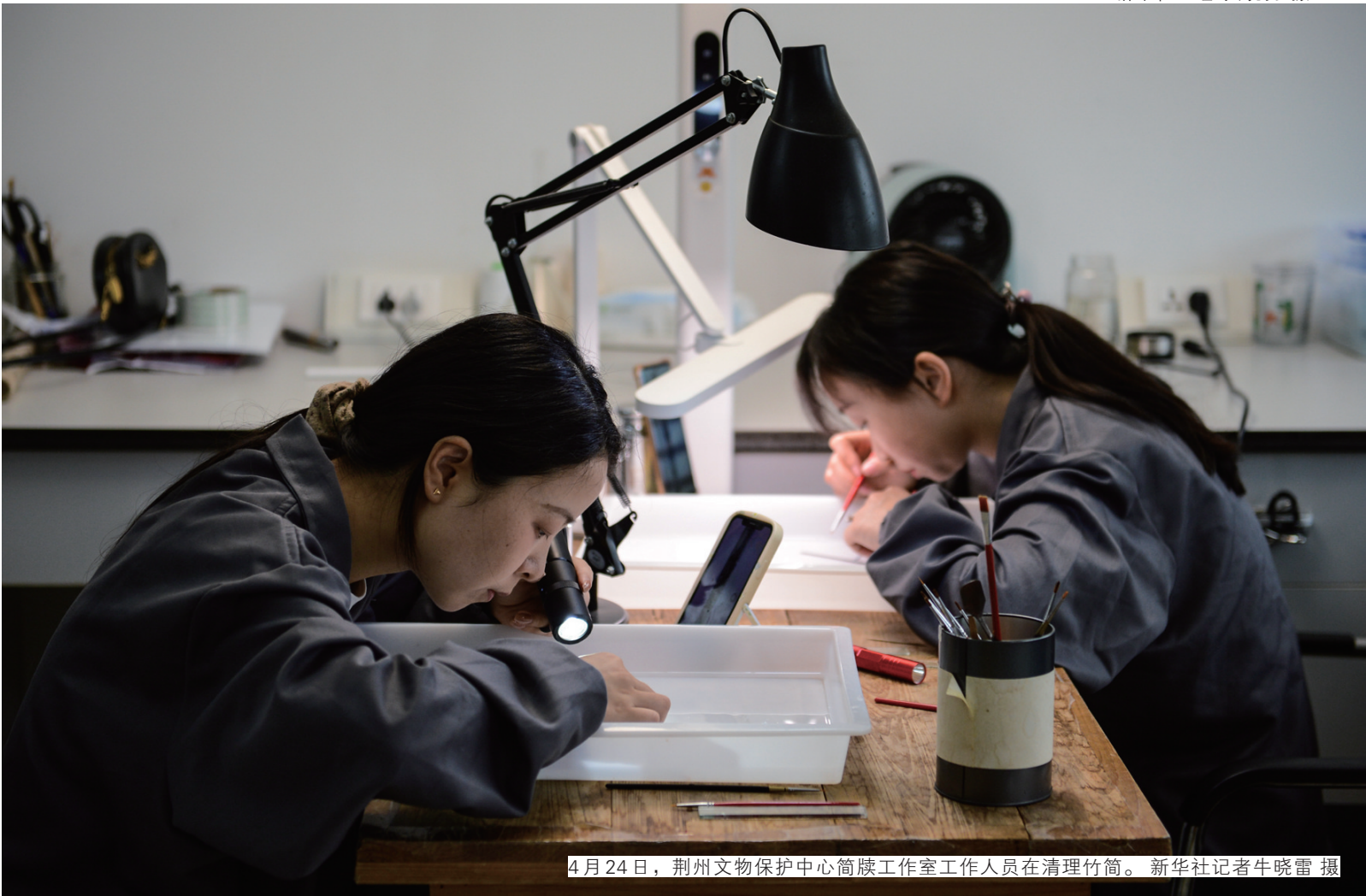
4月24日，荆州文物保护中心简牍工作室工作人员在清理竹简。