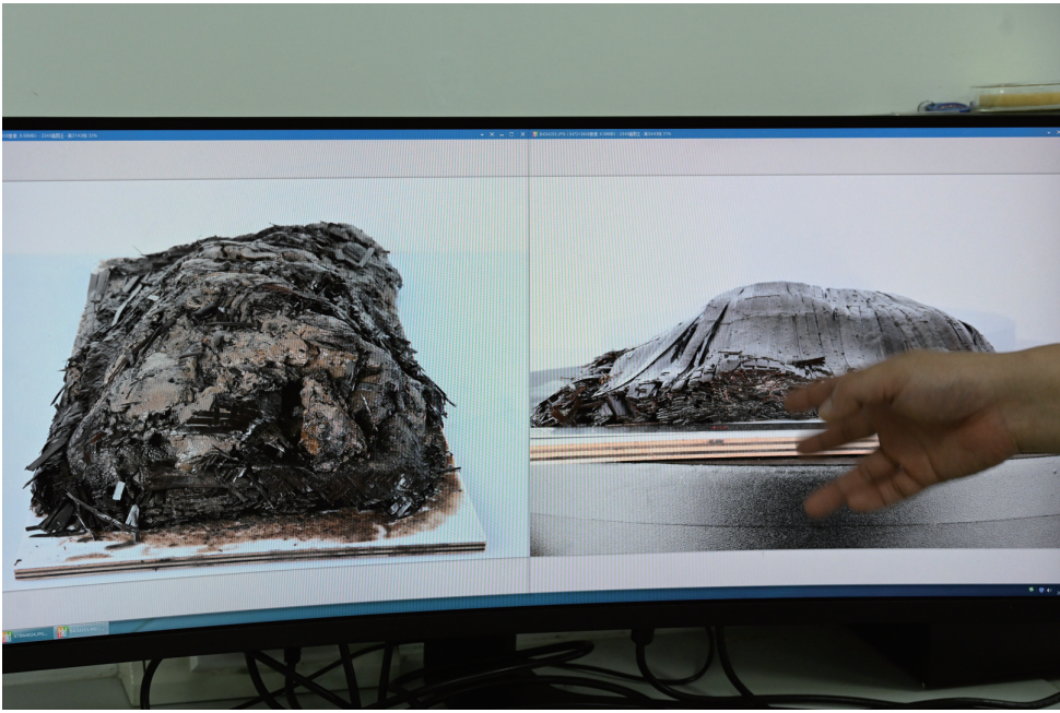
4月24日，荆州文物保护中心简牍工作室的工作人员在介绍去泥前后的简牍对比。