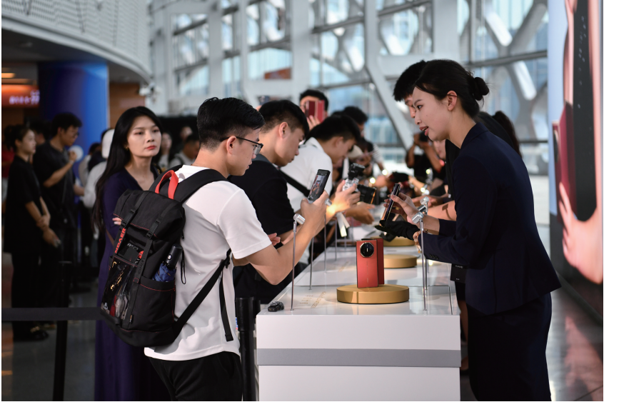
在深圳湾体育中心，观众在华为新品发布会现场体验华为手机（2024年9月10日摄）。