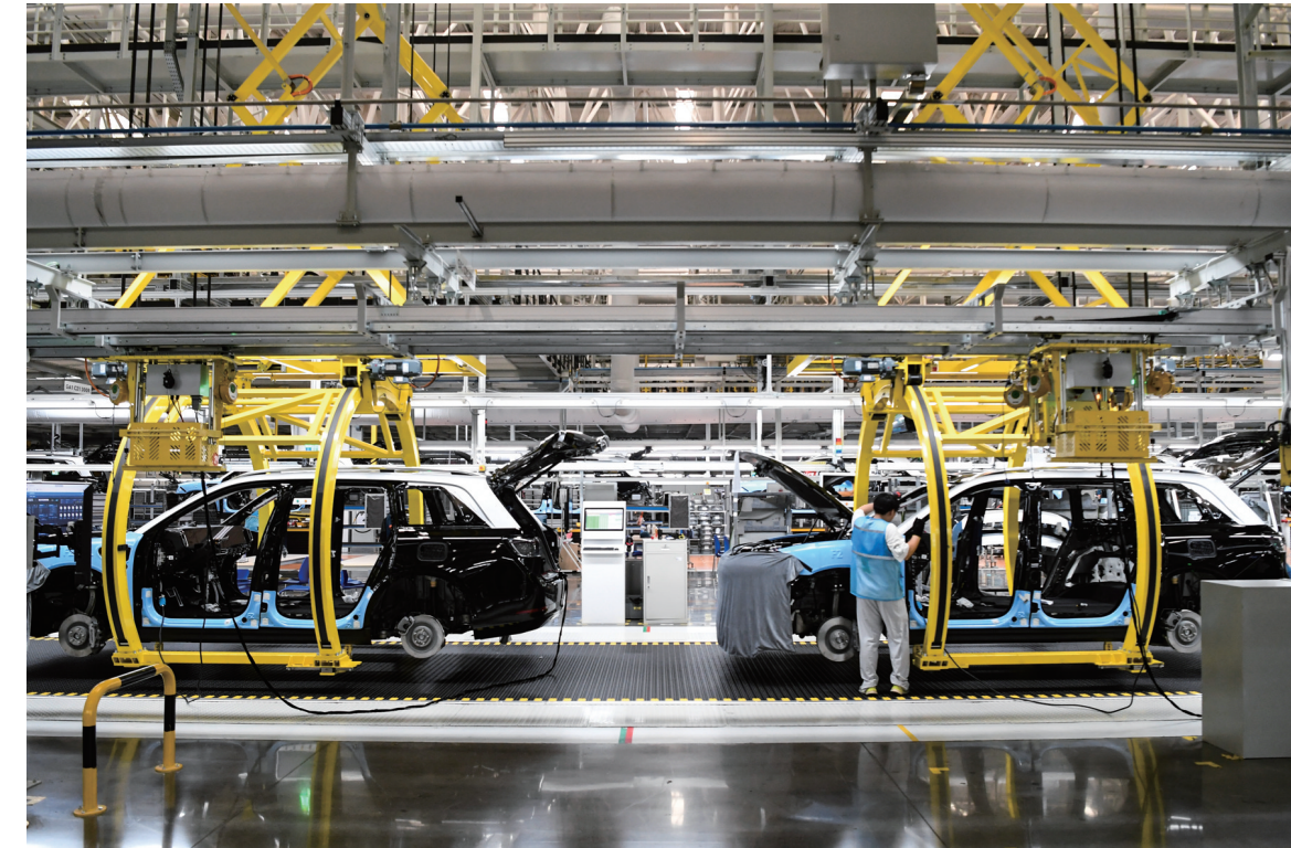
这是在位于重庆市两江新区的赛力斯汽车超级工厂拍摄的智能化生产作业现场（2024年6月7日摄）。

要有稳的基础，更要有进的动力。当考验接踵而至，如何增强接续性和竞争力？向新而进——中国产业以实践作答。 持续加码技术投入——关税摩擦中，服装制造商中洲国际董事长马建荣选择锻造韧性供应链。 深耕服装领域30多年，马建荣经历了金融危机带来的需求缩减，也遭遇过订单向周边转移风险，各种风浪让他深刻意识到，困难面前唯靠实力。 研发高端面料、打造智慧工厂，每年将至少一半的利润投向设备改造和工艺改良，从面料接单到成衣交付最快仅10天。凭借把制造做到极致，申洲在“红海市场”构筑起成本之外的优势，多年净利润率稳定在20%。 我国工业门类齐全、产业体系完备，但要进行全面提升，中低端要往上走，布局高端，才能适应新形势。 把传统产业转型升级作为建设现代化产业体系的重中之重：纺织业加大新材料研发，引入AI等技术重塑生产流程；钢铁业进入“减量发展、存量优化”阶段，重点企业机器人应用密度达65台（套）/万人；电子业推陈出新，折叠屏手机等领跑市场……在应对需求瓶颈和同质化竞争中迈向高端化、智能化、绿色化，“世界工厂”展现新颜。 与此同时，一个个新产业加快成长，曾经的“先手棋”正变成“新引擎”—— 年产量突破1300万辆，产销占全球比重超60%——10余年时间，中国新能源汽车从名不见经传到发展壮大，充分体现了把握时与势的超前布局。 2008年全球金融危机爆发，以产业结构优化推动经济增长的需求十分迫切。面对传统燃油车关键技术和话语权长期被跨国巨头掌控，基于能源安全等多重考量，发展新能源车成为突围的重要方向。 既无先机优势，又面对各种质疑，难度超乎想象，但认准了就坚定走下去：将发展新能源汽车上升为国家战略，先后推出一大批支持政策；集中合力攻克技术，筑起“三电”系统等“护城河”；把市场优势转为产业优势……锚定战略方向，持之以恒地投入，终以科技创新实现动力变革。 以育新机化危机。新能源、新一代信息技术、高端装备……应对挑战的过程中，一个个新产业向新优势产业转变，中国制造浮现新版图。 眼下，技术革命浪潮迭起，中国产业加快布局未来——