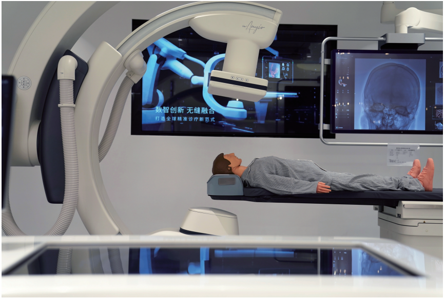
这是2024年9月10日在上海联影医疗展厅拍摄的智能影像设备。