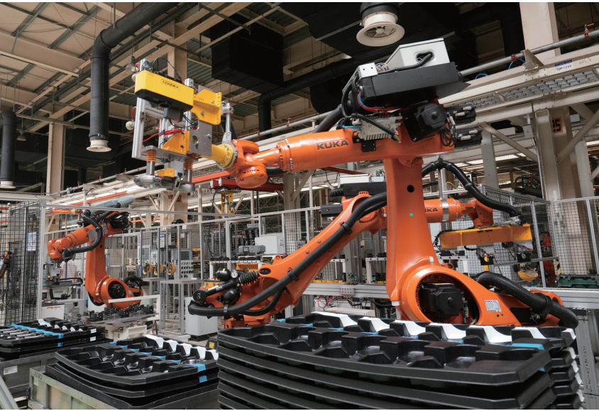
在位于江苏无锡市的一汽锡柴惠山工厂，智能制造车间里的协作机器人在作业（2024年6月3日摄）。