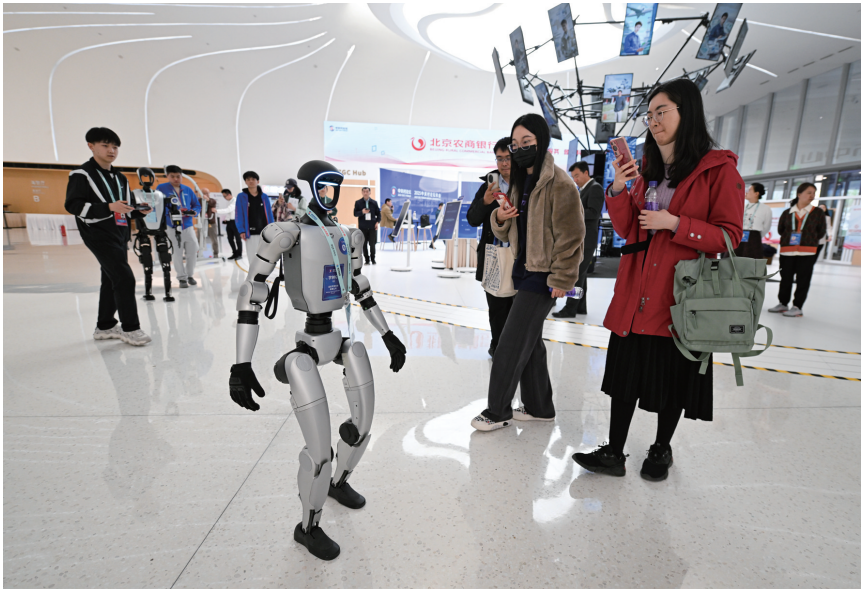
北京中关村国际创新中心的一款正在行走的宇树G1机器人吸引人们拍照留影（2025年3月26日摄）。