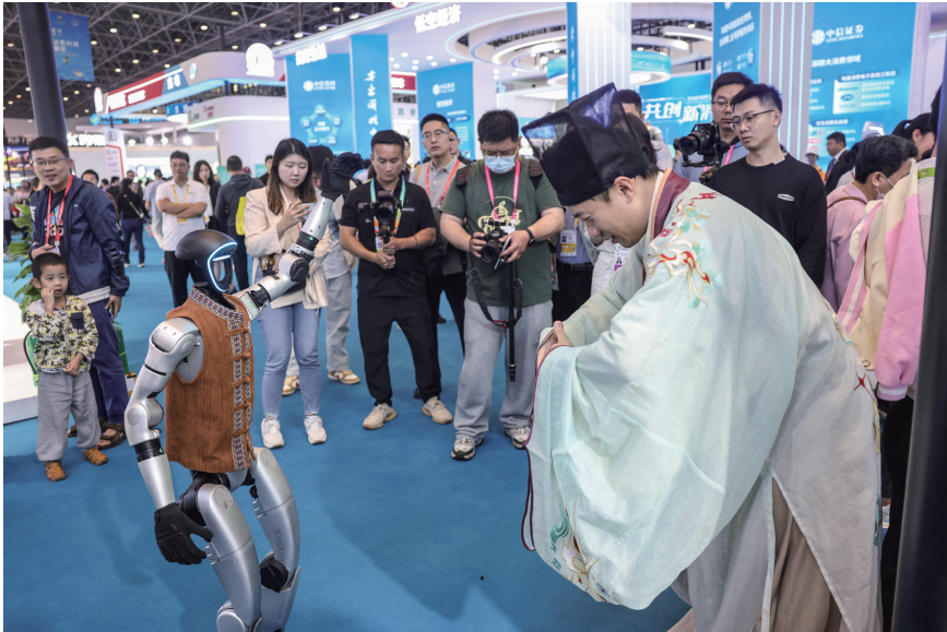
身着古装的观众在第五届消博会上与宇树科技的人形机器人互动（2025年4月13日摄）。