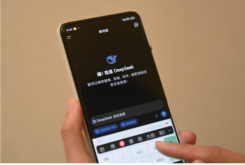
用户在DeepSeek手机客户端上提问（2025年2月17日摄）。

今年以来，全球经贸摩擦加剧，关税阴霾下，中国制造走势稳健—— 规模以上工业增加值同比增长6.5%，高技术制造业增加值同比增长9.7%，新能源汽车、工业机器人产品产量分别同比增长45.4%、26%……新出炉的一季度经济数据，勾勒出一个个产业逆势而行的上扬线。 把观察的时间轴拉长，能进一步感受到大国工业的步履铿锵：近年来面对一次次风浪考验，始终保持体量规模稳健，“新三样”崛起，5G、人形机器人领跑全球，一个个产业加速成长、不断壮大。 风雨洗礼，练就了中国制造的韧性力量，也让众多中国企业更加坚定，越是面对不确定因素，越要克难奋进，牢牢掌握发展主动权。