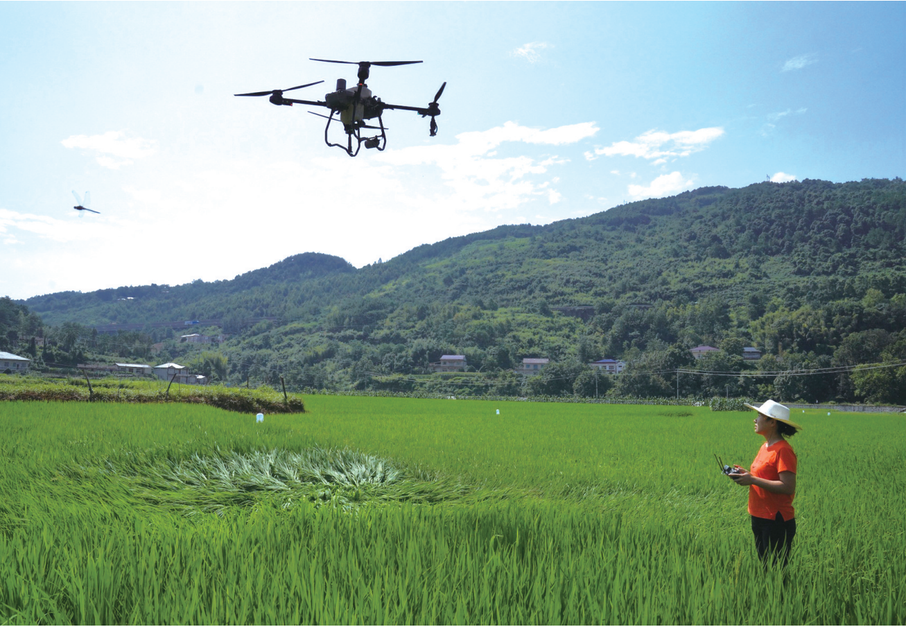
操作无人机喷洒杀菌剂