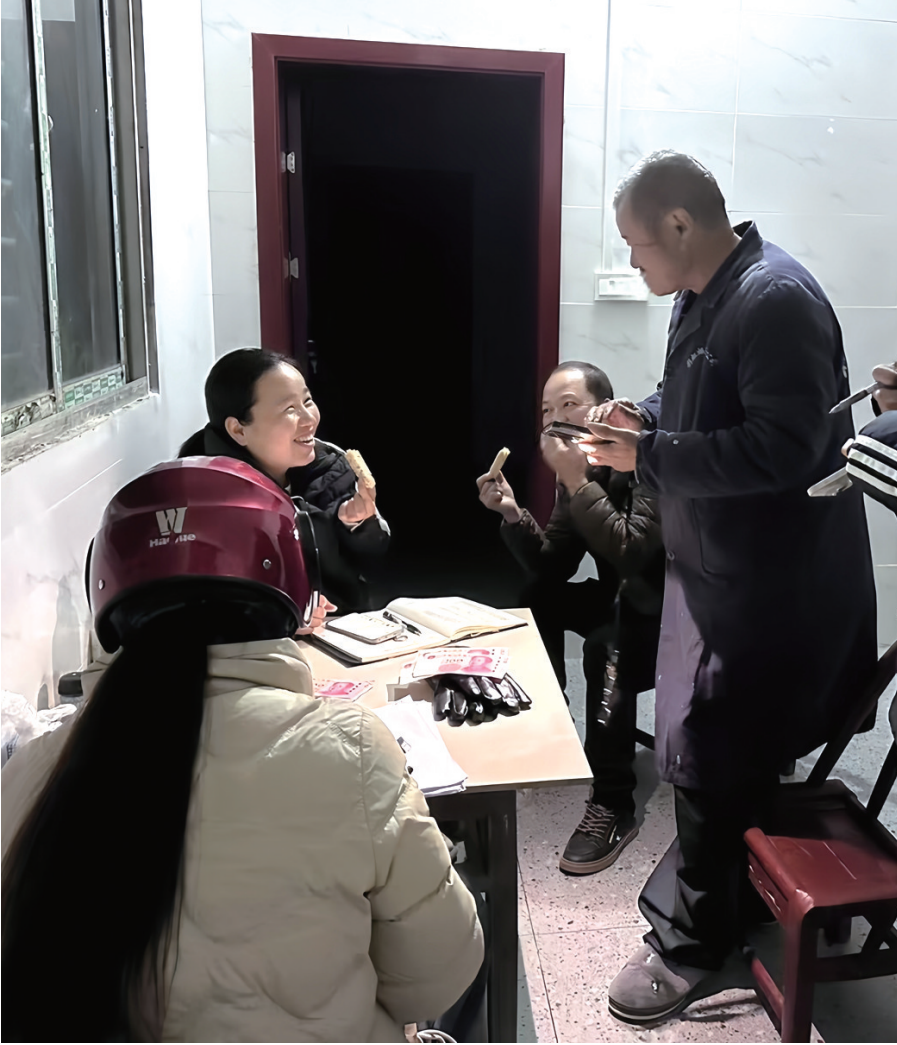
在群众家里宣讲政策