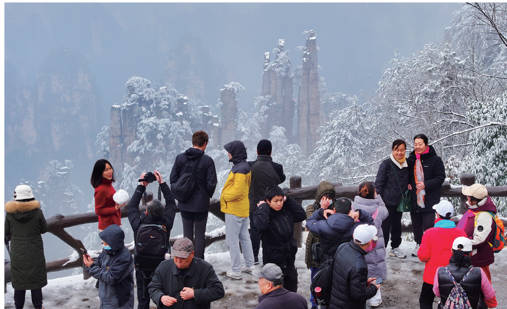
玩雪赏雪的游客络绎不绝