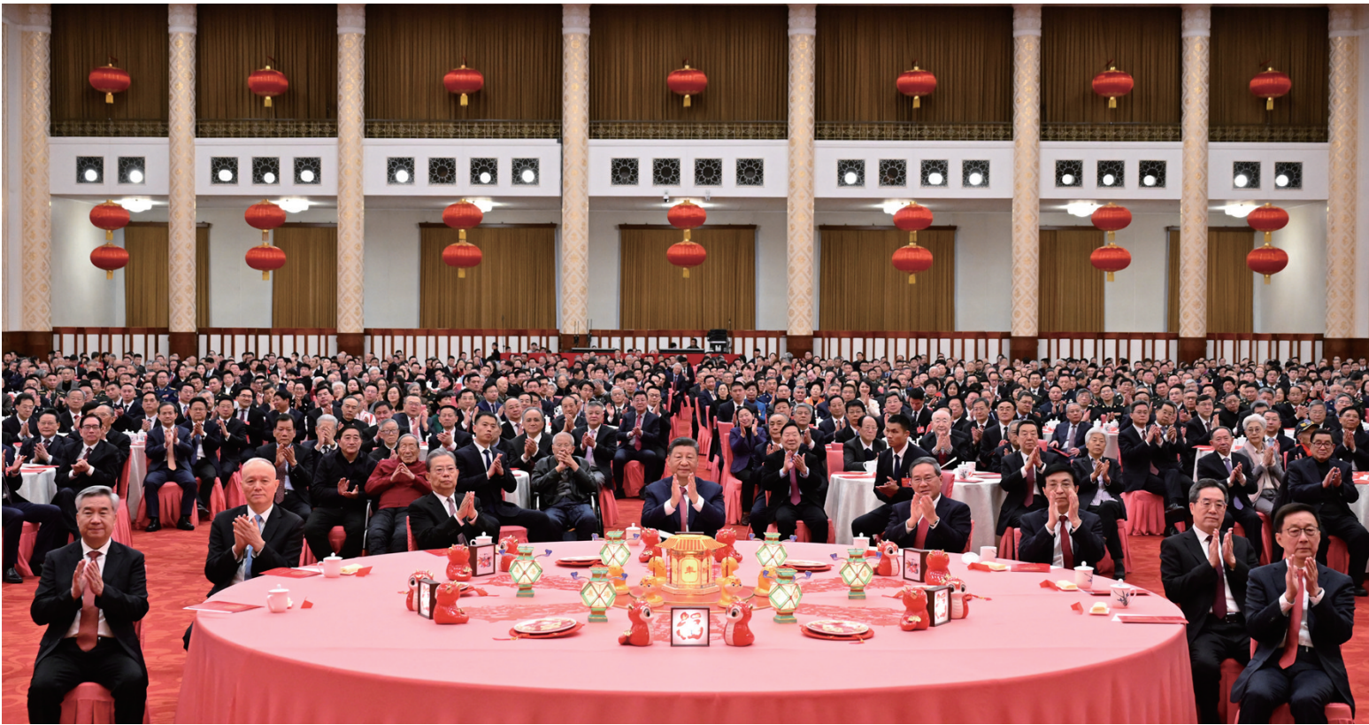
1月27日，中共中央、国务院在北京人民大会堂举行2025年春节团拜会。党和国家领导人习近平、李强、赵乐际、王沪宁、蔡奇、丁薛祥、李希、韩正等同首都各界人士欢聚一堂、共迎佳节。

新华社北京1月27日电 中共中央、国务院27日上午在人民大会堂举行2025年春节团拜会。中共中央总书记、国家主席、中央军委主席习近平发表讲话，代表党中央和国务院，向全国各族人民，向香港特别行政区同胞、澳门特别行政区同胞、台湾同胞和海外侨胞拜年。 习近平强调，即将过去的甲辰龙年，是我们振奋龙马精神、历经风雨彩虹的一年。一年来，面对复杂严峻形势，我们沉着应变、综合施策，攻坚克难、砥砺奋进，中国式现代化迈出新的重要步伐。 李强主持团拜会，赵乐际、王沪宁、蔡奇、丁薛祥、李希、韩正等出席。 人民大会堂宴会厅灯光璀璨、暖意融融，各界人士2000多人欢聚一堂、共迎佳节，现场洋溢着欢乐祥和的节日气氛。