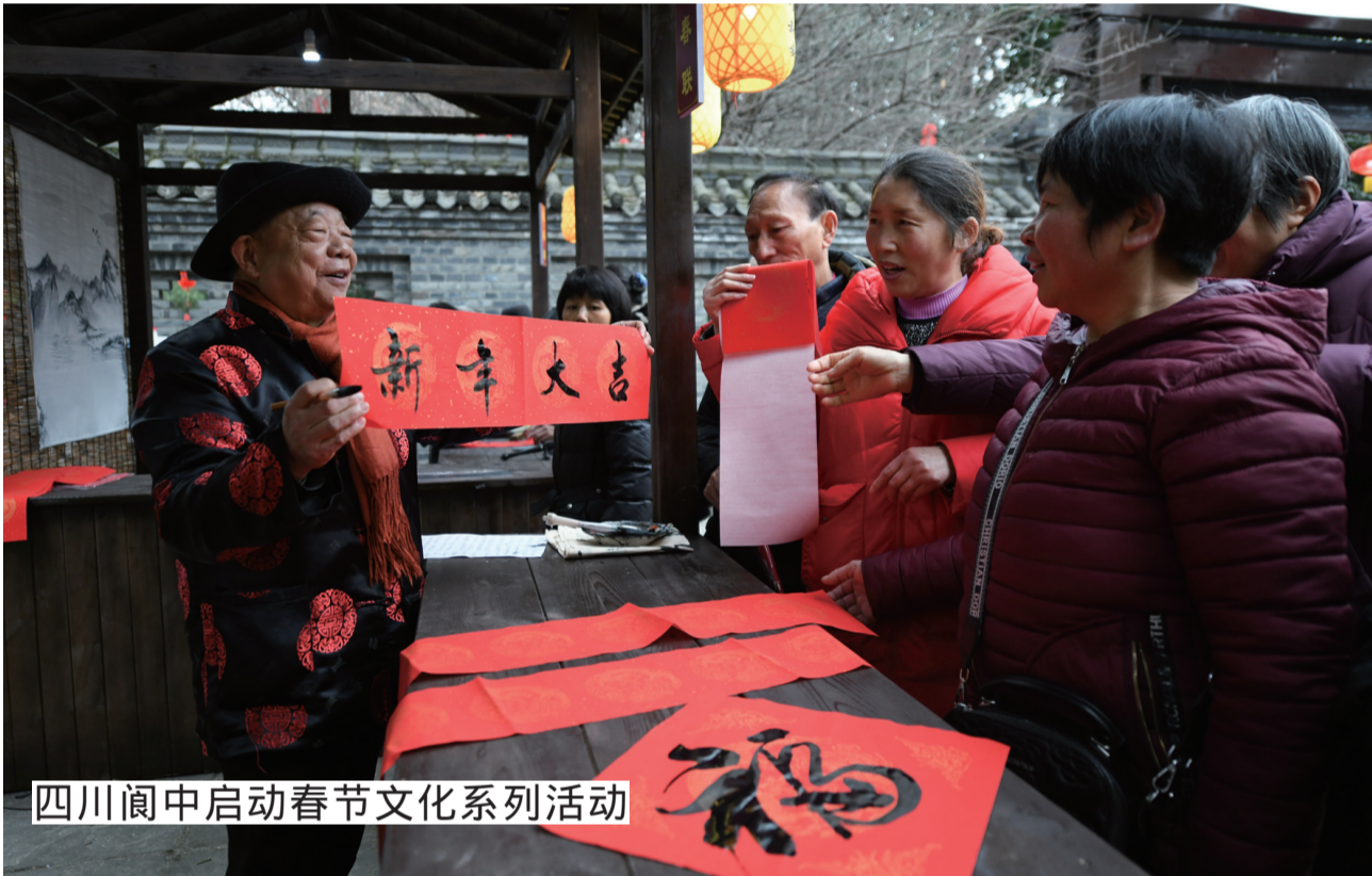
四川阆中启动春节文化系列活动

我们将继续优化产品供给，满足消费者多样化、个性化、便利化的金融服务需求，为消费市场加快恢复注入金融动力。马上消费金融公司董事长赵国庆表示。（记者 李延霞 吴雨）