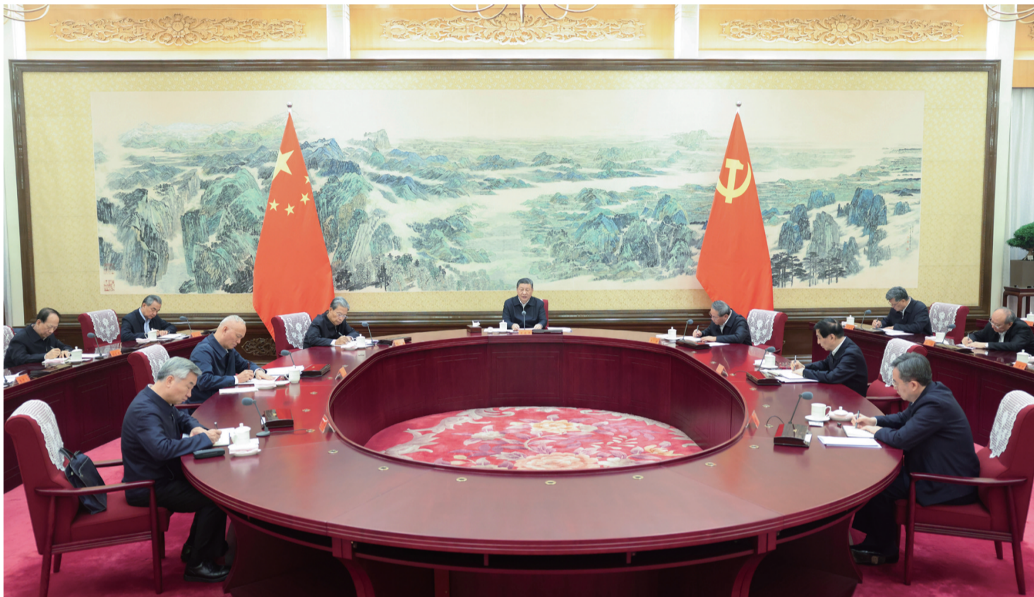
12月26日至27日，中共中央政治局召开民主生活会，中共中央总书记习近平主持会议并发表重要讲话。

新华社北京12月27日电 中共中央政治局于12月26日至27日召开民主生活会，深入学习贯彻习近平新时代中国特色社会主义思想，围绕巩固深化党纪学习教育成果、综合发挥党的纪律教育约束和保障激励作用，把学习贯彻纪律处分条例、落实中央八项规定执行情况作为检查的重要内容，结合思想和工作实际进行自我检视、党性分析，开展批评和自我批评。 中共中央总书记习近平主持会议