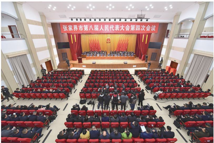
大会会场

市委书记刘革安在会上讲话。他指出，一年来，全市各级人大和广大代表深入学习贯彻习近平总书记关于坚持和完善人民代表大会制度的重要思想，在庆祝全国人民代表大会成立70周年大会上的重要讲话精神，围绕中心、服务大局，始终与市委同心同德、同向同行，紧贴人民群众所想所盼，认真履行宪法和法律赋予的职责，为全市高质量发展和民主法治建设作出了重要贡献。大会期间，各位代表以饱满的政治热情、强烈的使命担当，依法履职尽责，积极建言献策，充分展现了奋发有为、昂扬向上的精神风貌。本次大会是一