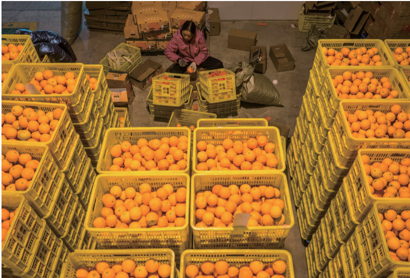
12月21日，工人在湖北省宜昌市秭归县脐橙小镇数字化电商中心包装鲜橙（无人机照片）。