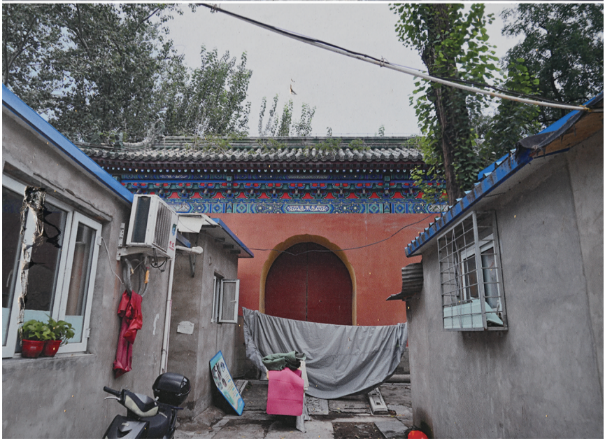
拼版照片：上图为腾退修缮后的庆成宫内宫门；下图为翻拍的庆成宫内宫门腾退修缮前的资料照片（12月21日摄）。

12月21日，北京中轴线上先农坛内的庆成宫首次面向社会公众开放。庆成宫原名斋宫，建于明天顺二年（1458年），是明清帝王在祭祀先农前斋戒的场所。清乾隆二十年（1755年）改建后更名为庆成宫，成为皇帝祭享先农、亲耕耤田礼成庆贺之所。庆成宫古建筑群布局恢宏、装饰精美，是先农坛内营造等级最高的皇家建筑群，体现出典型的明代皇家建筑风格。