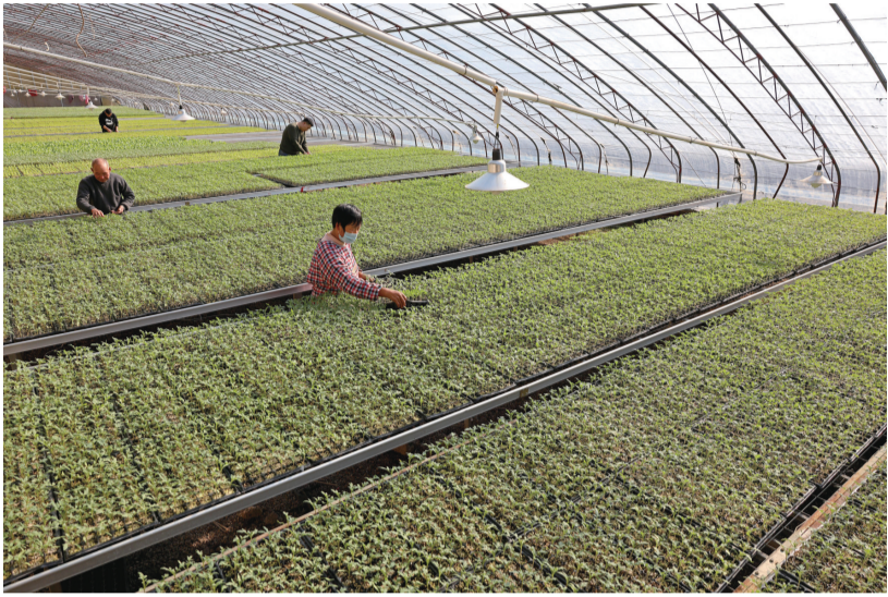
12月21日，山东省枣庄市市中区兴亮蔬菜农民专业合作社的农民在育苗大棚里管护西红柿秧苗。