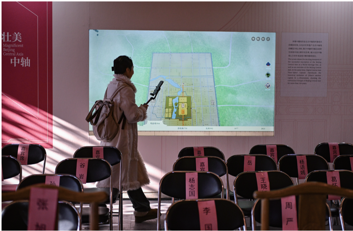
12月21日拍摄的庆成宫正殿内的数字展。