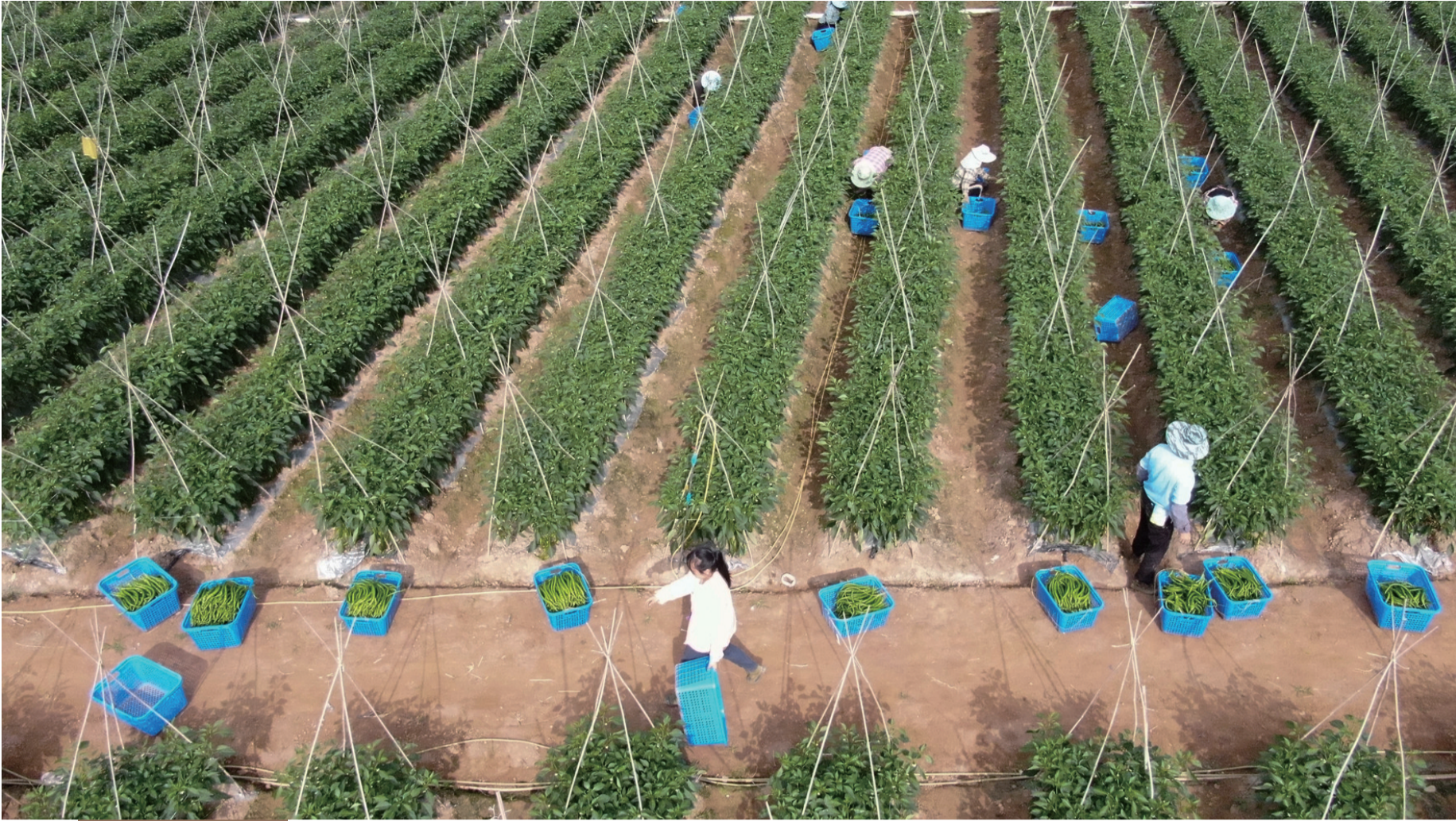
12月21日，云南省景洪市勐罕镇曼听村农民在采收辣椒（无人机照片）。