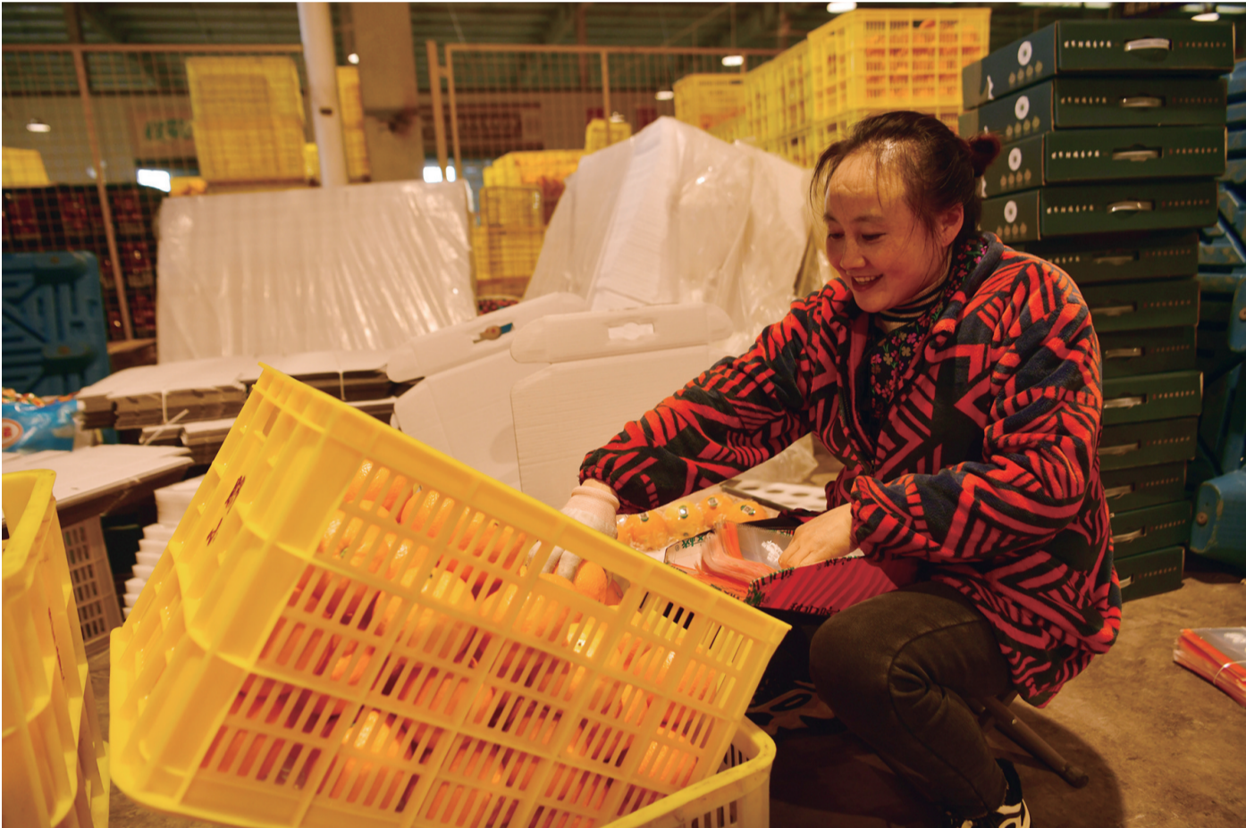
12月21日，工人在湖北省宜昌市秭归县脐橙小镇数字化电商中心包装鲜橙。