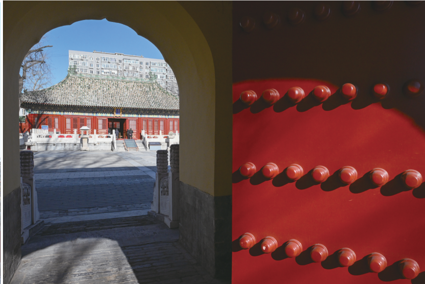
12月21日从庆成宫内宫门拍摄的正殿。