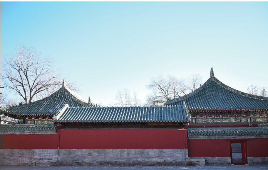
12月21日拍摄的庆成宫正殿（右）与后殿的屋顶。它们的屋顶为古代皇家建筑等级最高的庑殿顶，覆盖绿色琉璃瓦。