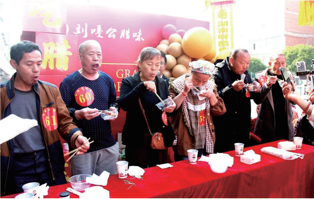
11月2日至3日，慈利县“刘嘎公”腊味土特产旗舰店举行了首届吃腊肉挑战赛，当地市民踊跃参赛。活动旨在通过“实体店+互联网”模式让消费者与优质的慈利土家族传统腊味产生链接，引导地域腊味走向全国。

一轮红日喷薄而出，戈壁滩迎来晴朗的一天，中国航天人又踏上新的征程。（新华社酒泉11月4日电）