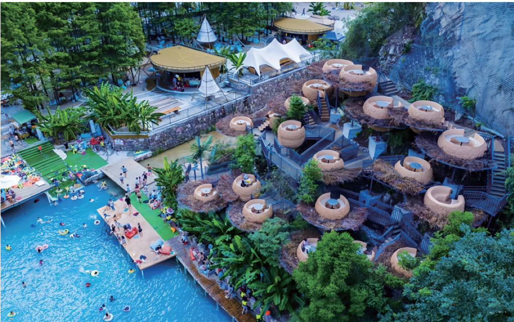
图为仙辰岛度假营地。