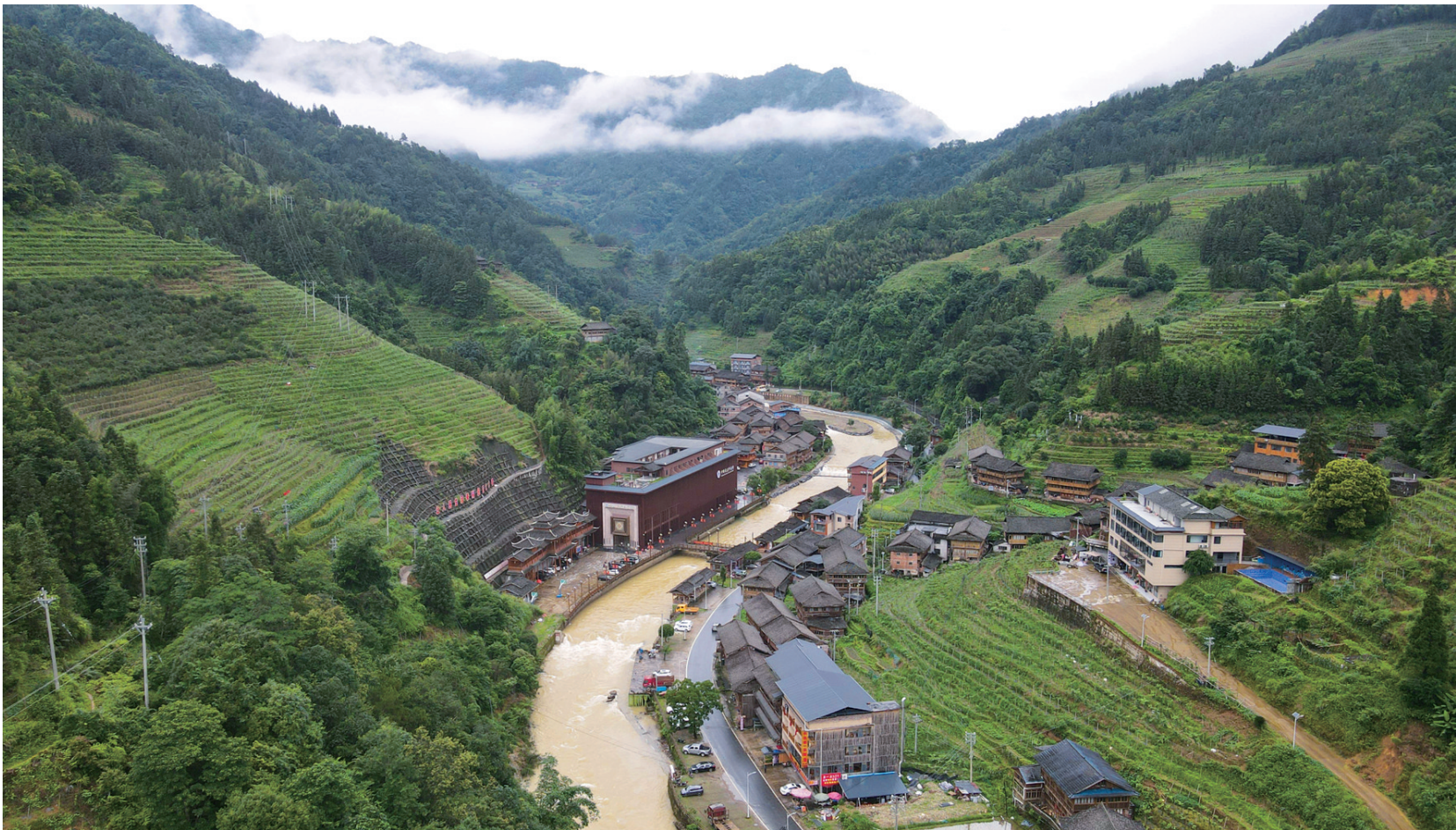
这是位于广西龙胜各族自治县龙脊镇的黄洛瑶寨（6月26日摄，无人机照片）。