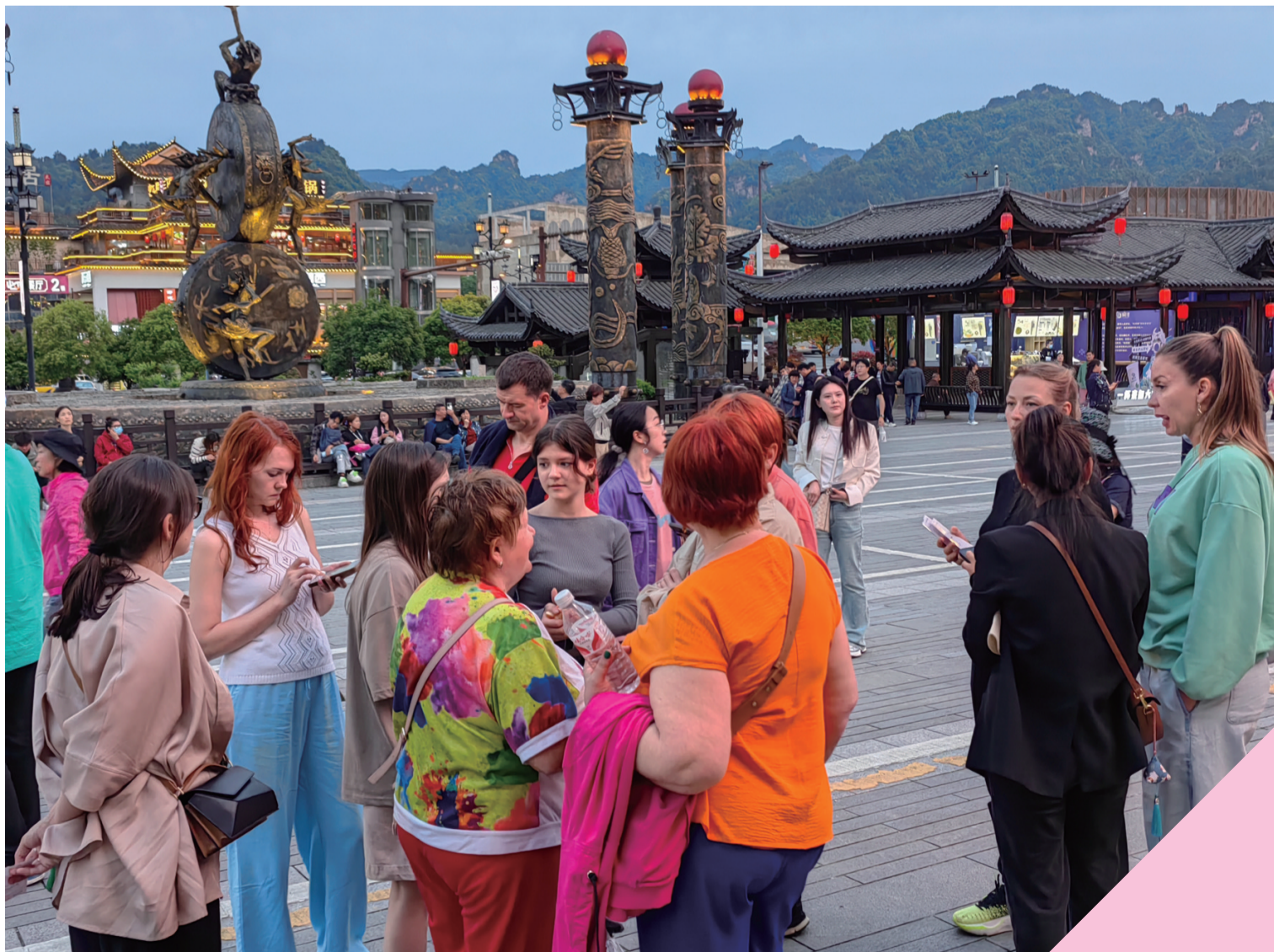
一批俄罗斯游客在魅力湘西文化广场。