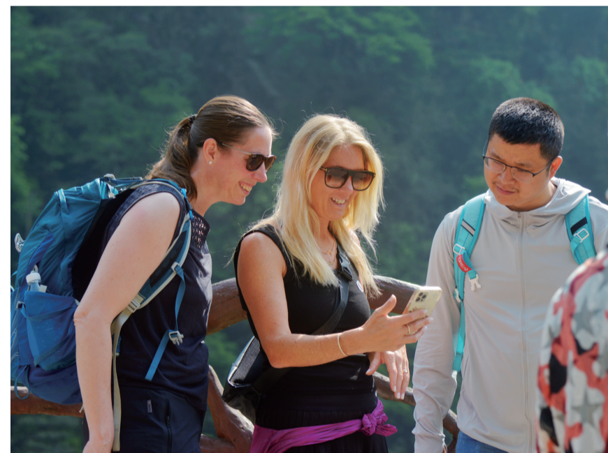
两名女外国游客在和导游员一起欣赏刚刚拍摄的张家界美景。