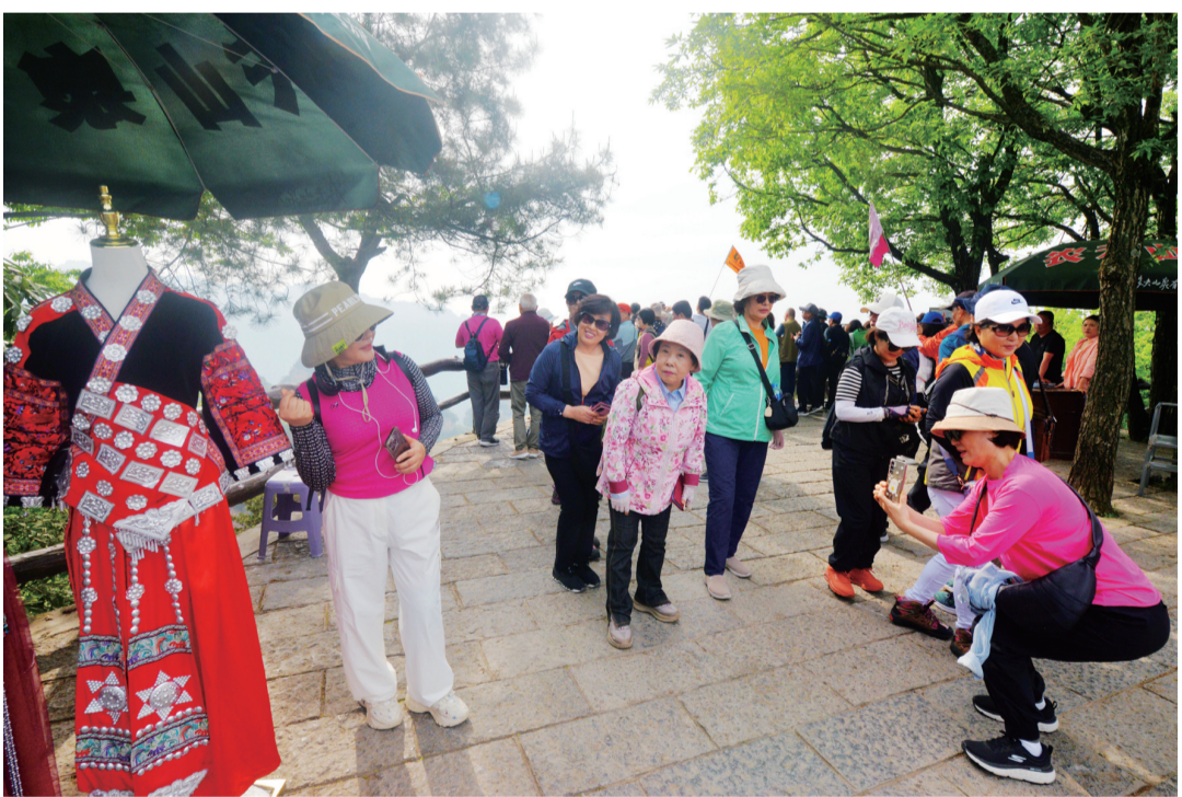
韩国游客体验张家界民族服装。