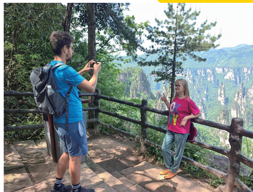
英国游客在天子山拍照留念。