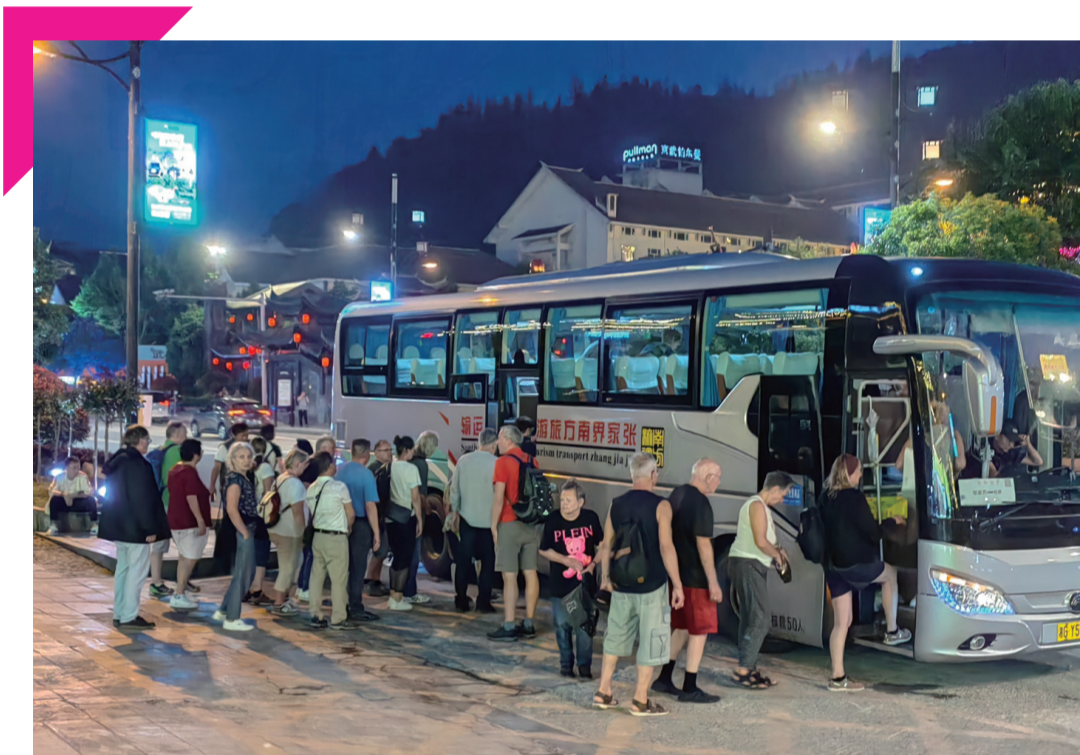
在武陵源城区上旅游大巴的欧美游客成群结队。