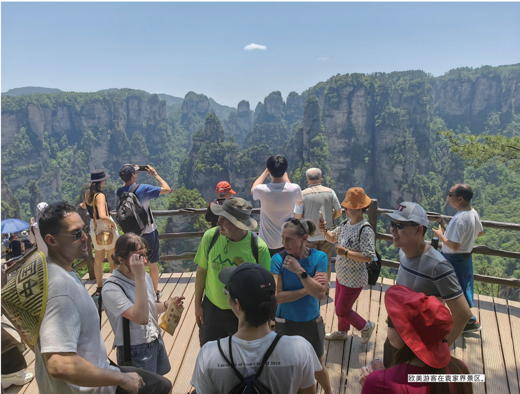
欧美游客在袁家界景区。