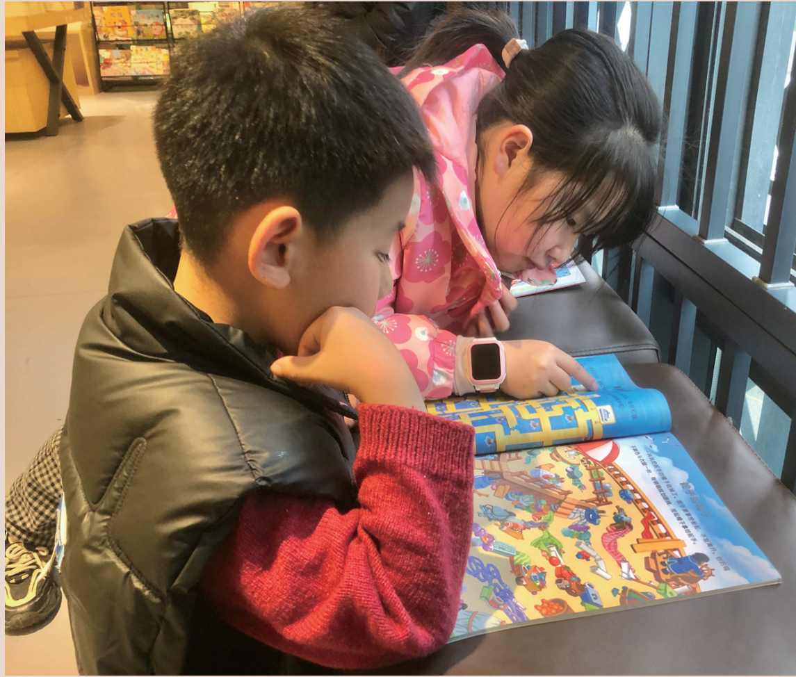
书香伴寒假。2月19日，孩子们在张家界市新华书店阅读。

我想，余生是离不开《菜根谭》的了，因人生之途总多风雨，需此 菜根 增长精神。我也愿做菜根，不断积累丰盈自己，持续砥砺躬耕，便年年得见灿烂的春天。