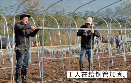
工人在给钢管加固。