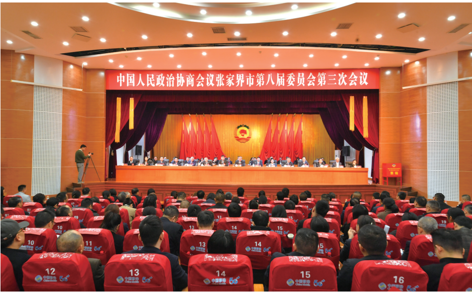
图为闭幕大会现场。

一要进一步提升站位，把准方向。要不忘政协初心，切实提高政治站位，把准正确的政治方向，深刻领悟“两个确立”的决定性意义，增强“四个意识”、坚定“四个自信”、做到“两个维护”，始终在思想上政治上行动上同以习近平同志为核心的党中央保持高度一致。要强化理论武装，坚持不懈用习近平新时代中国特色社会主义思想凝心铸魂，在全面学习、全面把握、全面落实上下功夫，统一思想、统一行动，不断提高政治协商、民主监督、参政议政的能力和水平，不断巩固和发展团结奋斗的共同思想政治基础。