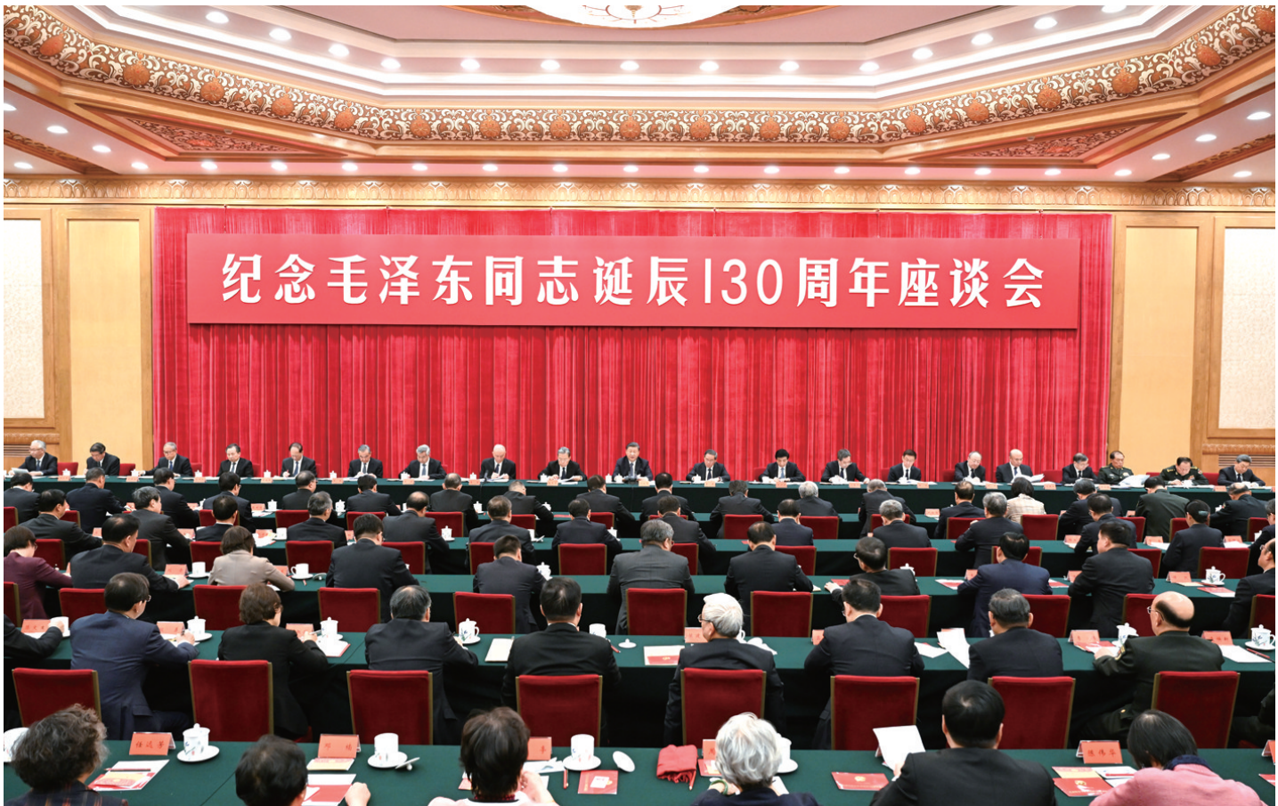
12月26日，中共中央在北京人民大会堂举行纪念毛泽东同志诞辰130周年座谈会。习近平、李强、赵乐际、王沪宁、蔡奇、丁薛祥、李希、韩正等出席座谈会。

新华社北京12月26日电 中共中央26日上午在人民大会堂举行座谈会，纪念毛泽东同志诞辰130周年。中共中央总书记、国家主席、中央军委主席习近平发表重要讲话。他强调，毛泽东同志是伟大的马克思主义者，伟大的无产阶级革命家、战略家、理论家，是马克思主义中国化的伟大开拓者、中国社会主义现代化建设事业的伟大奠基者，是近代以来中国伟大的爱国者和民族英雄，是党的第一代中央领导集体的核心，是领导中国人民彻底改变自己命运和国家面貌的一代伟人，是为世界被压迫民族的解放和人类进步事业作出重大贡献的伟大的国际主义者。毛泽东思想是我们党的宝贵精神财富，将长期指导我们的行动。对毛泽东同志的最好纪念，就是把开创的事业继续推向前进。