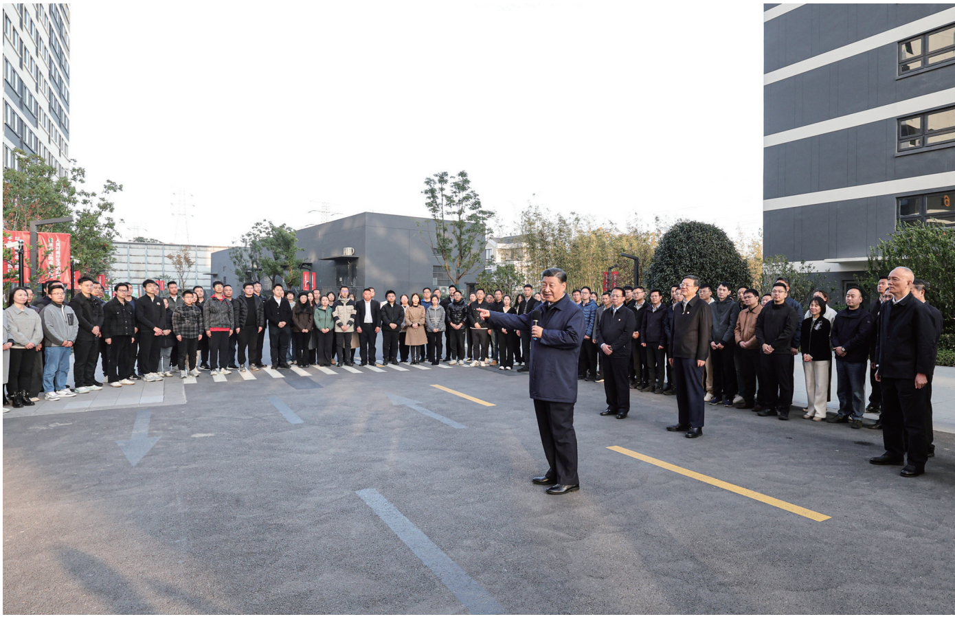
11月28日至12月2日，中共中央总书记、国家主席、中央军委主席习近平在上海考察。这是11月29日下午，习近平在闵行区新时代城市建设者管理者之家，同社区居民亲切交流。

新华社上海/江苏盐城12月3日电 中共中央总书记、国家主席、中央军委主席习近平近日在上海考察时强调，上海要完整、准确、全面贯彻新发展理念，围绕推动高质量发展、构建新发展格局，聚焦建设国际经济中心、金融中心、贸易中心、航运中心、科技创新中心的重要使命，以科技创新为引领，以改革开放为动力，以国家重大战略为牵引，以城市治理现代化为保障，勇于开拓、积极作为，加快建成具有世界影响力的社会主义现代化国际大都市，在推进中国式现代化中充分发挥龙头带动和示范引领作用。 11月28日至12月2日，习近平在中共中央政治局委员、上海市委书记陈吉宁和市长龚正陪同下，先后来到金融机构、科技创新园区、保障性租赁住房项目等进行调研。 28日下午，习近平一下列车就前往上海期货交易所考察。他结合电子屏幕和重要上市品种交割品展示，听取交易所增强全球资源配置能力、服务实体经济和国家战略等情况介绍，了解交易所日常资金管理和交割结算等事项。习近平强调，上海建设国际金融中心目标正确、步伐稳健、前景光明，上海期货交易所要加快建成世界一流交易所，为探索中国特色期货监管制度和业务模式、建设国际金融中心作出更大贡献。 习近平随后乘车来到浦东新区张江科学城，参观上海科技创新成果展。他结合视频短片了解上海市科技创新整体情况，走进展厅详细察看基础研究、人工智能、生物医药等领域的科技创新成果展示，并同科研人员代表亲切交流。习近平指出，推进中国式现代化离不开科技、教育、人才的战略支撑，上海在这方面要当好龙头，加快向具有全球影响力的科技创新中心迈进。要着力造就大批胸怀使命感的尖端人才，为他们发挥聪明才智创造良好条件。 近年来，上海市加快保障性租赁住房建设，为许多来沪