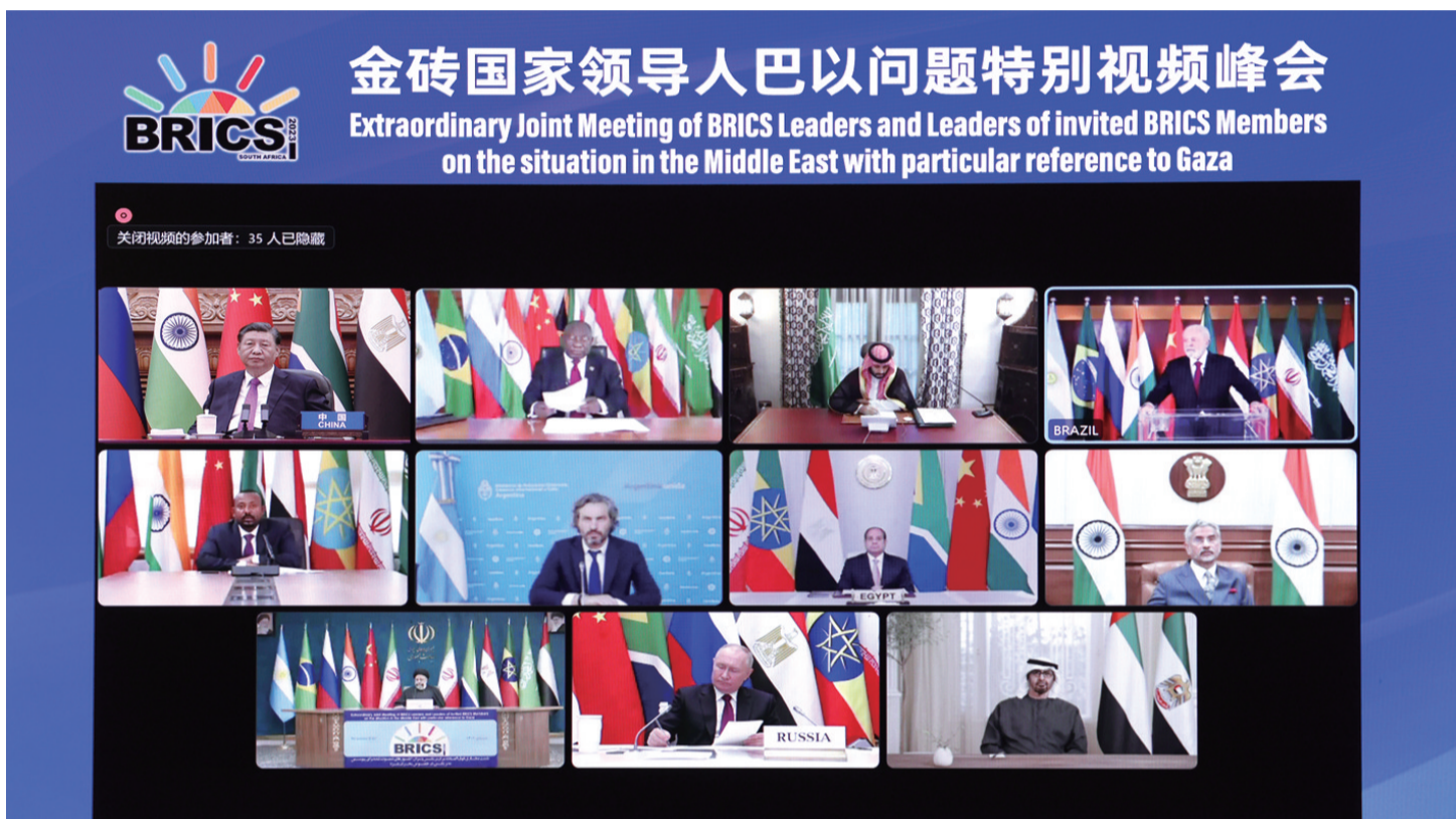
11月21日晚，国家主席习近平出席金砖国家领导人巴以问题特别视频峰会并发表题为《推动停火止战 实现持久和平安全》的重要讲话。

新华社北京11月21日电 11月21日晚，国家主席习近平出席金砖国家领导人巴以问题特别视频峰会并发表题为《推动停火止战 实现持久和平安全》的重要讲话。（讲话全文见2版） 习近平指出，本次峰会是金砖扩员后的首场领导人会晤。当前形势下，金砖国家就巴以问题发出正义之声、和平之声，非常及时、非常必要。加沙地区的冲突已持续一个多月，造成大量平民伤亡和人道主义灾难，并出现扩大外溢趋势，中方深表关切。当务之急，一是冲突各方要立即停火止战，停止一切针对平民的暴力和袭击，释放被扣押平民，避免更为严重的生灵涂炭。二是要保障人道主义救援通道安全