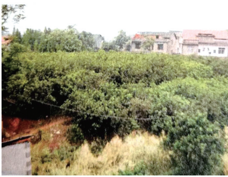
金台遗址出土的打制石器。

先秦（旧石器时期--公元前221年）是指秦朝建立之前的历史时代。本文依据慈利的考古成果，结合历史文献资料和研究成果，对慈利的先秦文明进行综述。