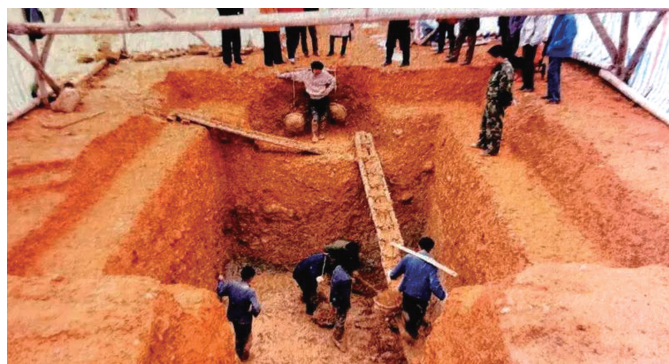
骑龙岗九 古墓挖掘现场。

近期，县文管所对新城区太平明故县城进行了考古挖掘，发现明县城城墙是建在一米多高的坚实的土夯城墙之上的，其遗存有近900米。这段土夯城墙究竟建于何时？太平是不是当时慈利最早的政治文化中心之城？期待考古、史学新成果。