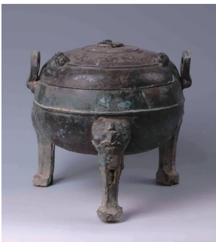
官地和骑龙岗古墓群出土的青铜器物。