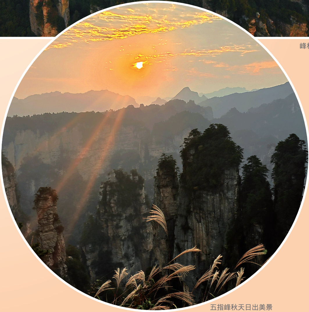
五指峰秋天日出美景