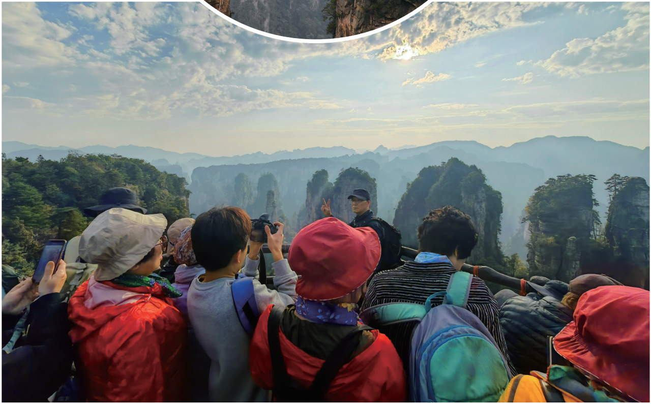
中外游客争睹张家界秋景