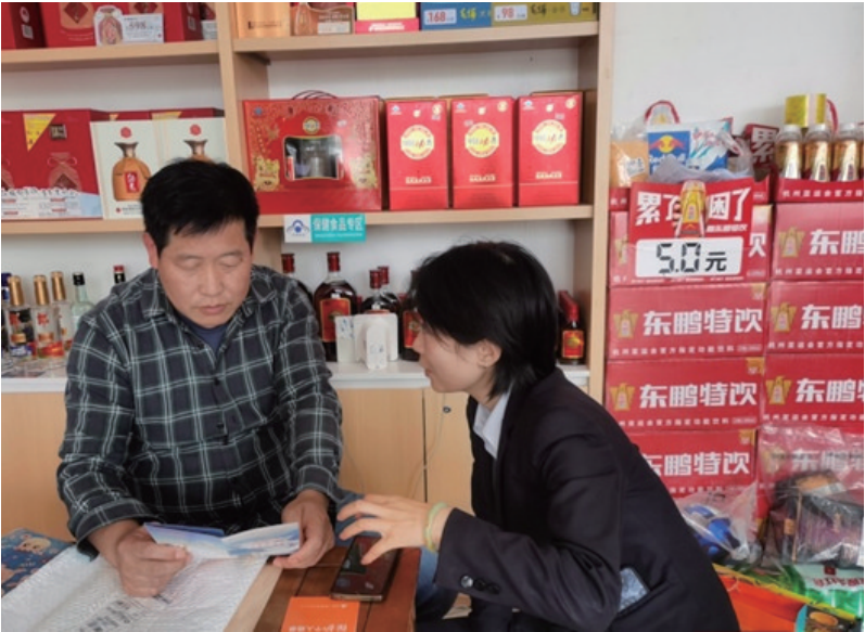
工作人员为商户讲解金融知识。

近日，工商银行武陵源支行积极响应普及金融知识，传播金融正能量，宣传日工作安排，组织开展消保宣传进景区、进商圈活动，切实提高广大商户、旅客对金融消费者权益的