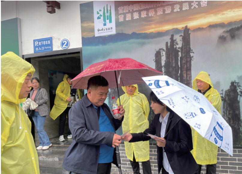
工作人员为游客宣讲金融知识。