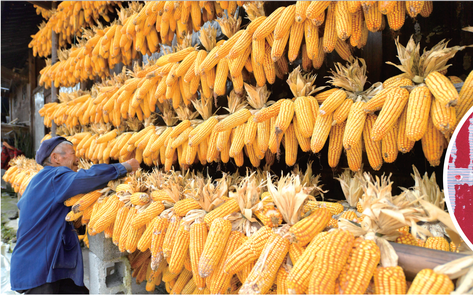
10月18日，湖北省宣恩县李家河镇回龙村农民在房前晾玉米。