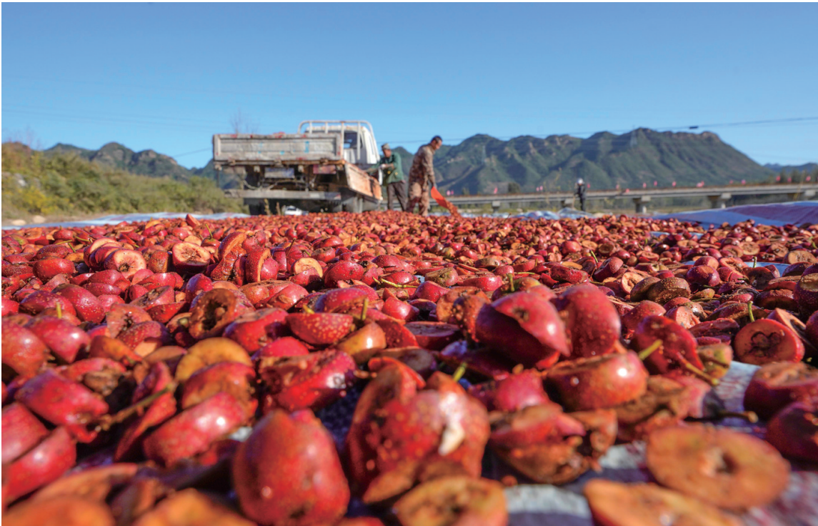
10月18日，农民在河北省遵化市一家果品专业合作社晒场晾晒山楂干。