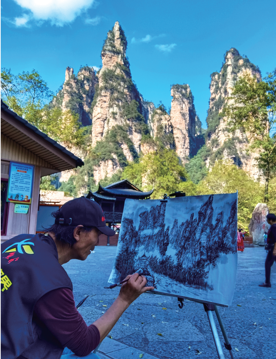
画家在张家界武陵源写生。