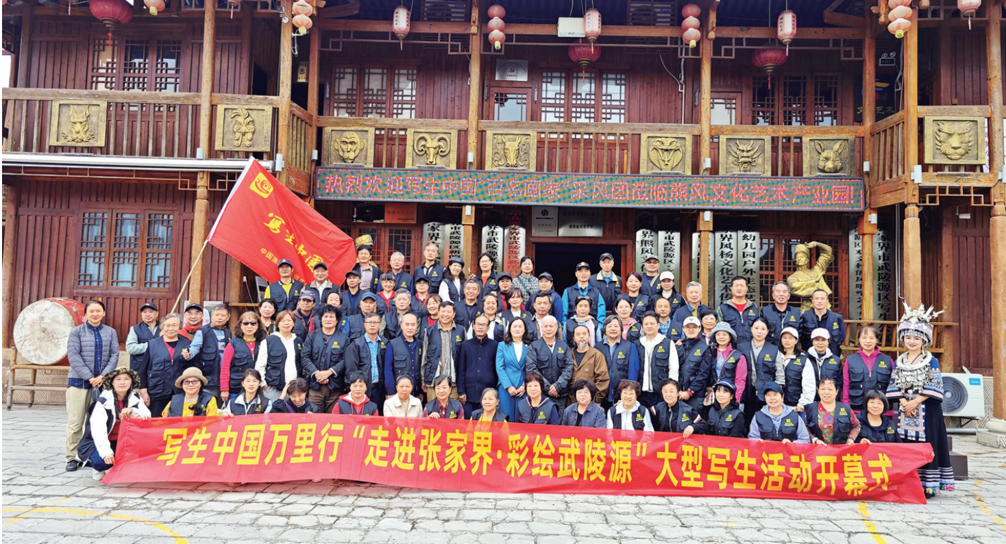
百名画家相聚武陵源。