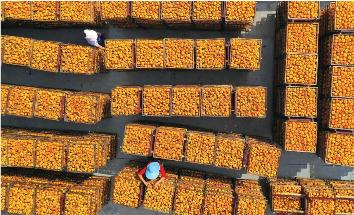
10月18日，在广西桂林市恭城瑶族自治县嘉会镇泗安村，村民在整理月柿（无人机照片）。