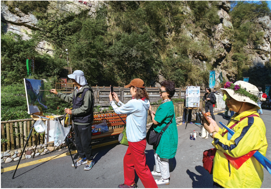
画中作画，景里有景。

据了解，100名美术家于10月13日抵达张家界熊风文化艺术产业园，参加为期11天的写生中国万里行 走进张家界 彩绘武陵源 大型文化活动。期间，各位美术家们先后深入张家界国家森林公园、宝峰湖、黄龙洞、溪布街、白虎堂等景区景点进行油画、国画、水彩画等艺术创作，精美作品将通过各种平台进行集中展示。