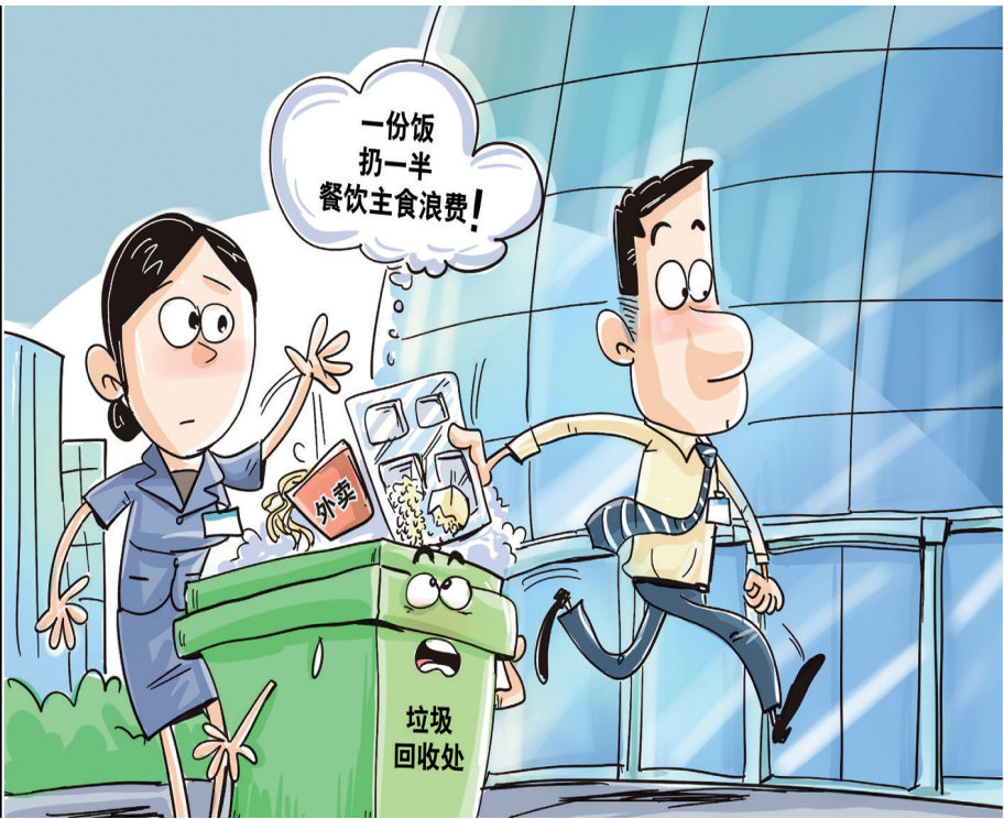
餐饮浪费