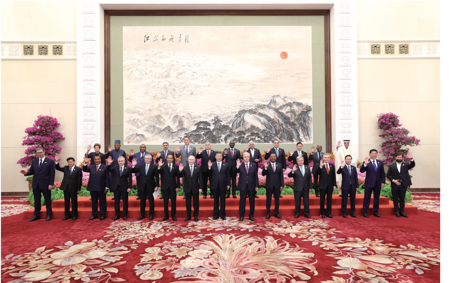
10月18日上午，国家主席习近平在北京人民大会堂出席第三届 一带一路 国际合作高峰论坛开幕式并发表题为《建设开放包容、互联互通、共同发展的世界》的主旨演讲。这是会前，习近平同出席高峰论坛的外国国家元首、政府首脑和国际组织负责人等国际贵宾集体合影。

新华社北京10月18日电（记者涂铭 孙奕）10月18日上午，国家主席习近平在人民大会堂出席第三届 一带一路 国际合作高峰论坛开幕式并发表题为《建设开放包容、互联互通、共同发展的世界》的主旨演讲。习近平宣布中国支持高质量共建 一带一路 的八项行动，强调中方愿同各方深化 一带一路 合作伙伴关系，推动共建 一带一路 进入高质量发展的新阶段，为实现世界各国的现代化作出不懈努力。 金秋时节，天高气爽，风清日朗。天安门广场上，共建 一带一路 国家国旗迎风飘扬，相映成辉。出席高峰论坛的外国国家元首、