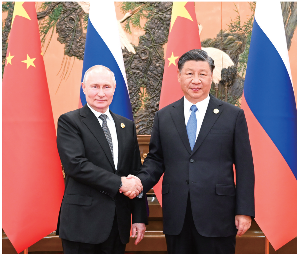
10月18日中午，国家主席习近平在北京人民大会堂同来华出席第三届 一带一路 国际合作高峰论坛的俄罗斯总统普京举行会谈。