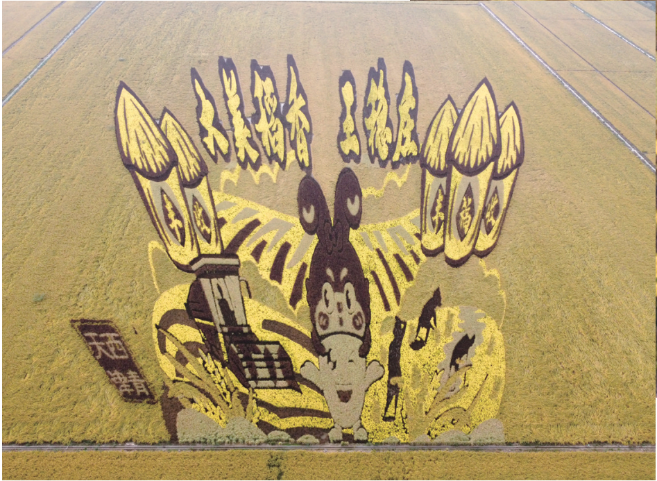
天津市西青区王稳庄镇种植的稻田画（10月8日摄，无人机照片）。