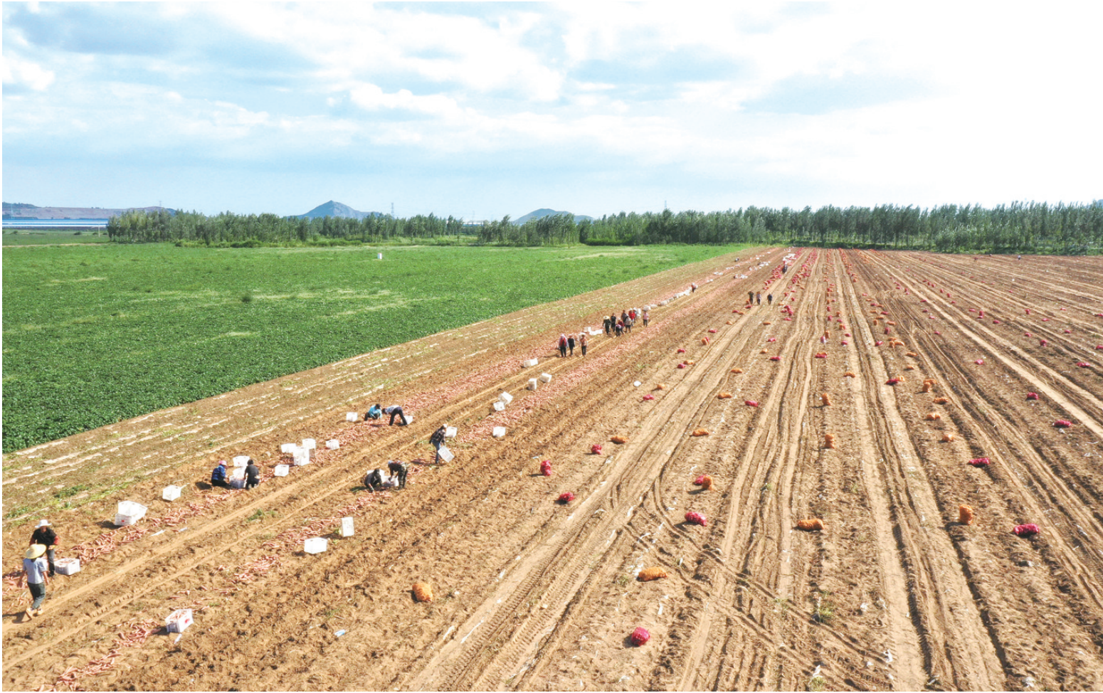
8月28日，滦州市九百户镇一家鲜食红薯种植合作社的社员在田间收获烟薯（无人机照片）。