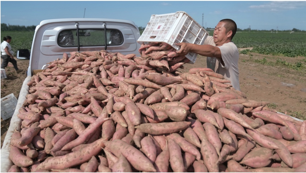
8月28日，滦州市九百户镇一家鲜食红薯种植合作社的社员在将收获的红薯装车。