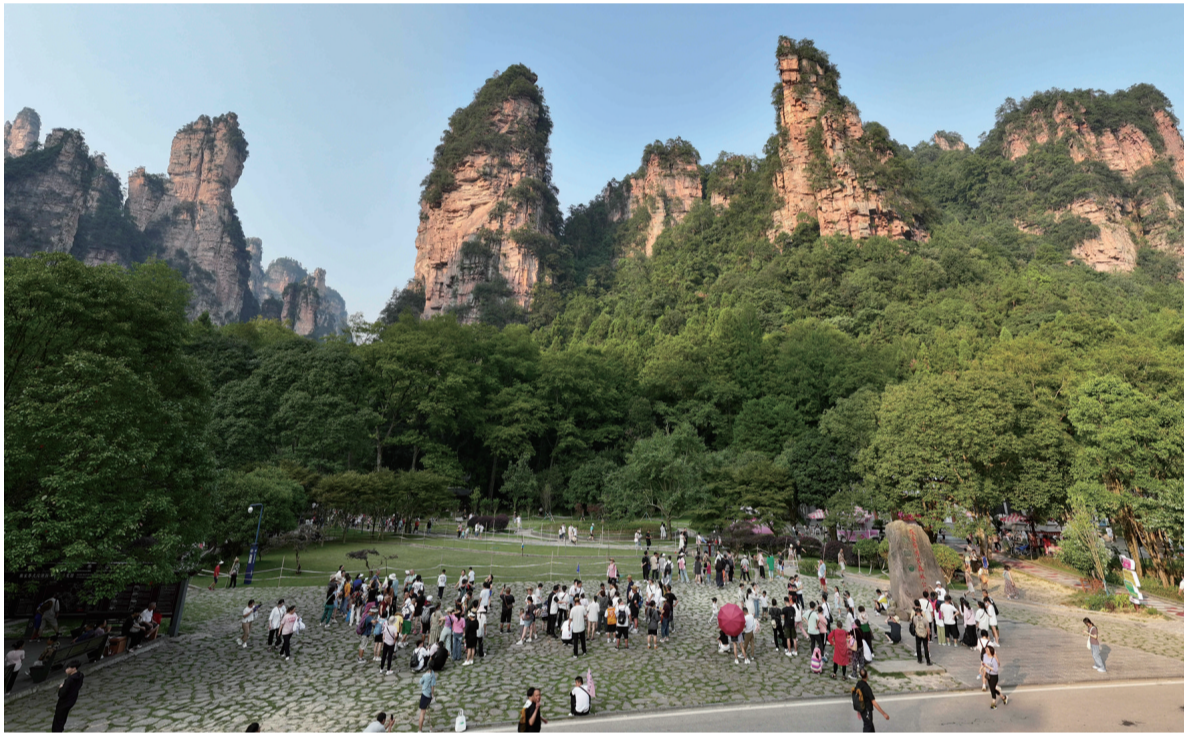
位于张家界国家森林公园老磨湾广场的老磨湾综合提质项目,总占地面积47941.64平方米,目前成长记忆馆、志愿者服务中心、森林露营地、名人题词文化长廊、同心锁周边环境整治等基础设施提质已竣工验收。预计整体项目完工时间为2025年12月,届时将进一步丰富景区旅游资源的多样性,完善景区的相关基础设施,改善旅游环境,为游客提供一个更好了解张家界文化的窗口。

此次行动是三家馆乡狠抓乡风文明建设的一个缩影,通过对滥办酒席发现一起、查处一起、警示一片,引导辖区群众远离陈规陋习,使移风易俗家喻户晓,深入人心。