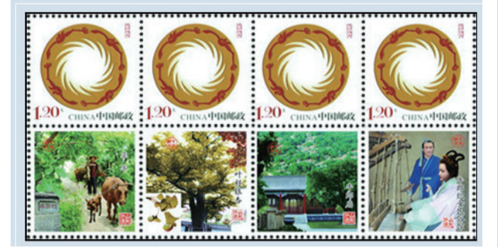
《牛郎织女》个性化邮票