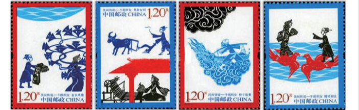
《民间传说 牛郎织女》特种邮票