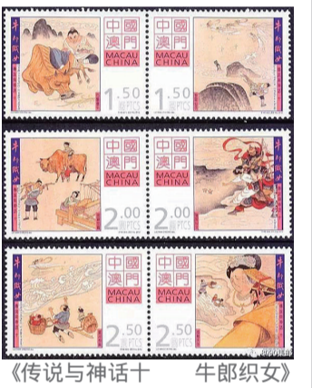
《传说与神话十 牛郎织女》