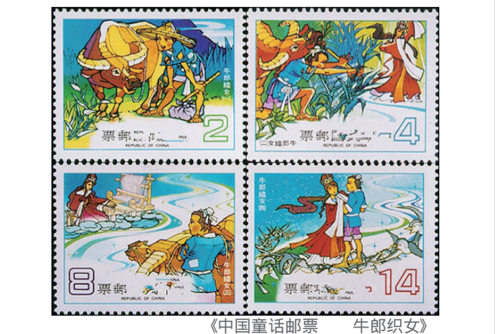
《中国童话邮票 牛郎织女》

七夕节是中华民族共同的浪漫记忆,是华夏儿女血脉中世代流淌的文化基因。在我国港澳台地区发行的邮票中,有关七夕 鹊桥相会 的爱情故事也呈现于方寸之中。如:1981年8月6日(七夕节),我国台湾省发行的《中国童话邮票 牛郎织女》邮票一套4枚,图案分别为 老牛报信 留衣结缘 天河永隔 鹊桥相会;1994年6月8日,中国香港邮政发行的《中国传统节日》邮票的第三枚 七夕,主图为中国传统木版年画《鹊桥相会》;2012年8月23日(七夕节),中国澳门邮政发行的《传说与神话十 牛郎织女》邮票一套6枚,小型张一枚。图案分别为 巧医灵牛 智取仙衣 男耕女织 强捉仙女 银河相隔 和 感动大帝,小型张 鹊桥相会。6枚邮票加上小型张,将牛郎织女的故事演绎得更加精彩。