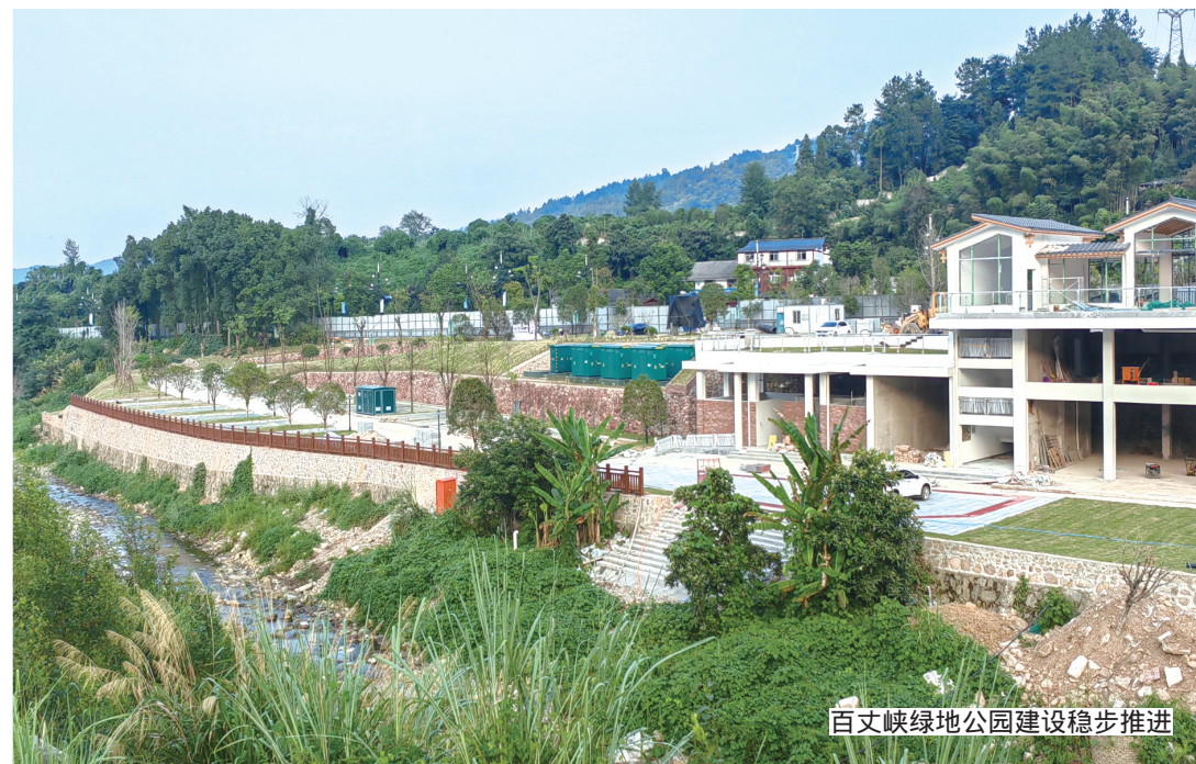
百丈峡绿地公园建设稳步推进