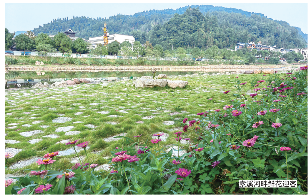
索溪河畔鲜花迎客