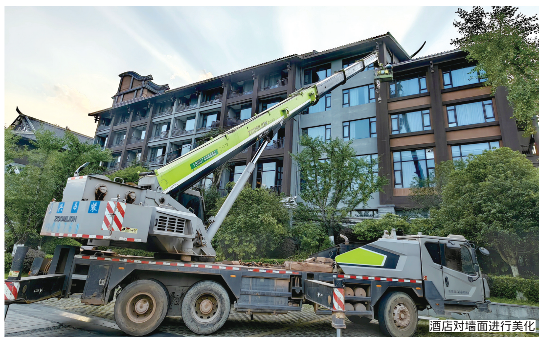
酒店对墙面进行美化