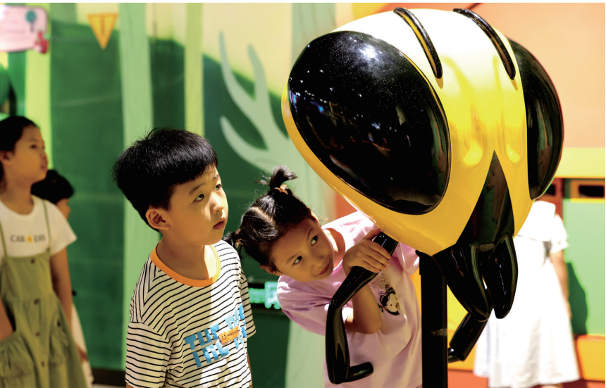
◀7月30日，在山东省枣庄市科技馆，小朋友在了解“小黄蜂”飞行的奥秘。 新华社发（孙中喆 摄）