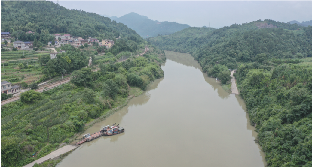
这是位于慈利县的冷水渡口，也是张家界最后一个汽车轮渡。