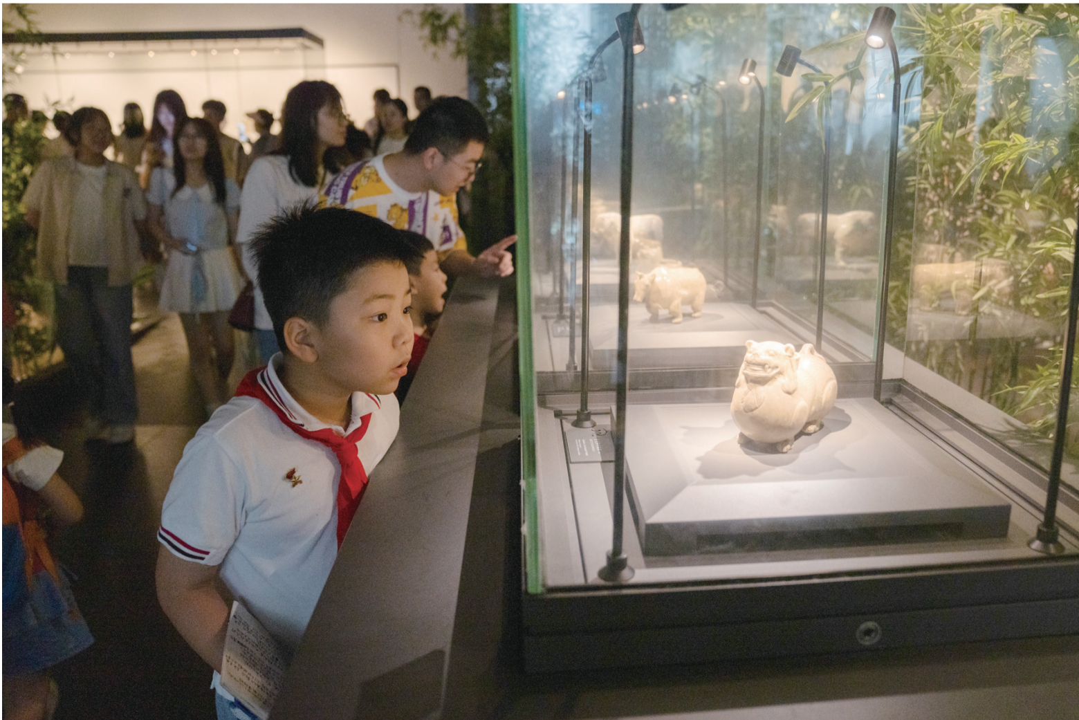
7月30日，小朋友在江苏省南京市六朝博物馆内参观。

暑假期间，孩子们参加文体、休闲活动，走进博物馆、科技馆等场所，用各种方式充实假期生活。