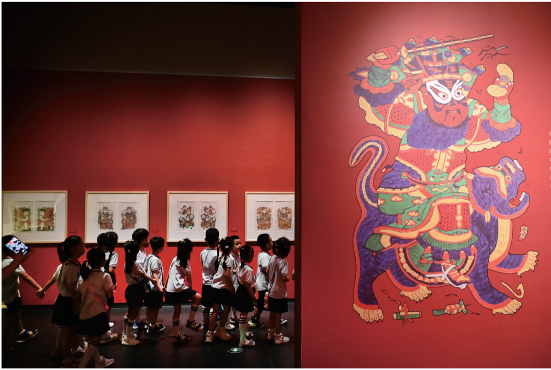
▲7月28日，孩子们在开封博物馆内参观。