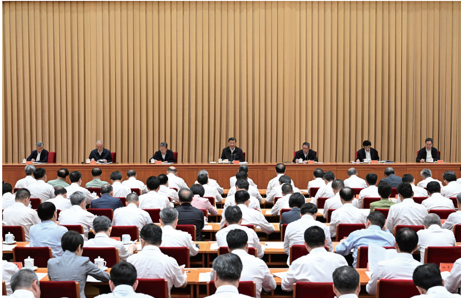
7月17日至18日，全国生态环境保护大会在北京召开。中共中央总书记、国家主席、中央军委主席习近平出席会议并发表重要讲话。李强、赵乐际、王沪宁、蔡奇、丁薛祥、李希出席会议。

新华社北京7月18日电 全国生态环境保护大会17日至18日在北京召开。中共中央总书记、国家主席、中央军委主席习近平出席会议并发表重要讲话强调，今后5年是美丽中国建设的重要时期，要深入贯彻新时代中国特色社会主义思想，坚持以人民为中心，牢固树立和践行绿水青山就是金山银山的理念，把建设美丽中国摆在强国建设、民族复兴的突出位置，推动城乡人居环境明显改善、美丽中国建设取得显著成效，以高品质生态环境支撑高质量发展，加快推进人与自然和谐共生的现代化。