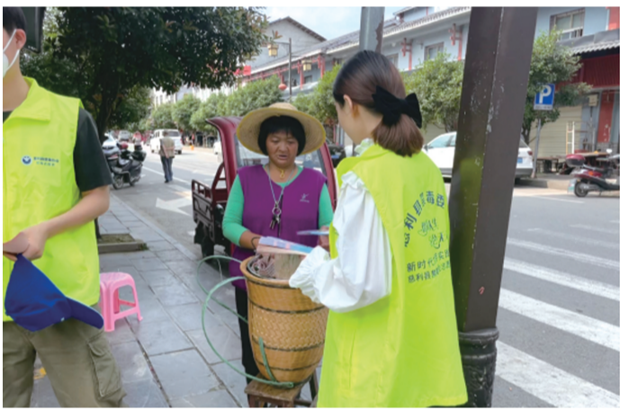
给群众发放宣传资料。

为增强群众防范非法集资意识，提高防范非法集资能力，全力构筑诈骗防火墙，守护好人民群众的“钱袋子”。近日，慈利县三官寺土家族乡平安办组织开展防范非法集资宣传月活动。