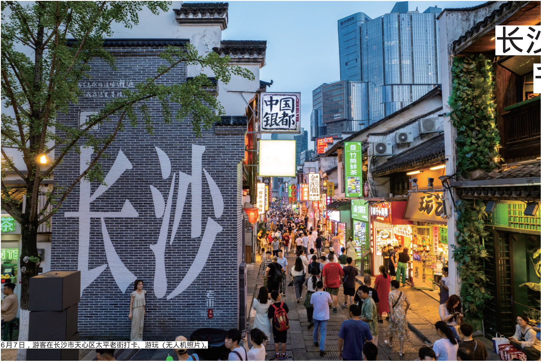
6月7日，游客在长沙市天心区太平老街打卡、游玩（无人机照片）。