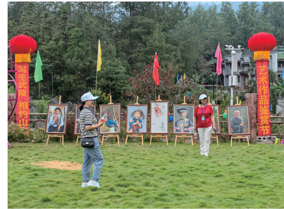
绘画展吸引游客打卡。

米酒喝起来，山歌对起来，舞蹈跳起来 6月15日，武陵源区熊风文化艺术产业园启动首届艺术季活动。 本次艺术季活动由武陵源区文联、熊风文化艺术产业园联合主办，旨在推动文学艺术与旅游的深度融合，以艺术产业赋能乡村振兴，展示张家界至醇至美的文化馨香。各地文艺爱好者参观了园区独特的艺术民宿、绘画展览、雕塑园等人文景点，现场 品尝 了一道道人文融入自然、传统融入现代的艺术大餐。 把诗和远方 搬到离自己最近的地方。本次艺术季总策划人熊风表示，将通过多届艺术季活动，以画之名、以诗之名、以茶之名，努力把熊风文化艺术产业园打造成大家的 诗和远方 。