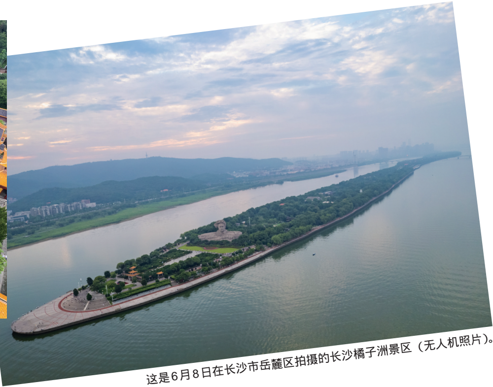
这是6月8日在长沙市岳麓区拍摄的长沙橘子洲景区（无人机照片）。