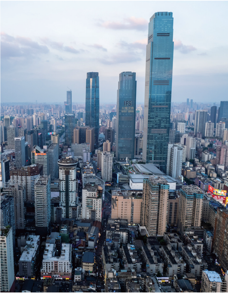
这是6月7日拍摄的长沙城区景色（无人机照片）。